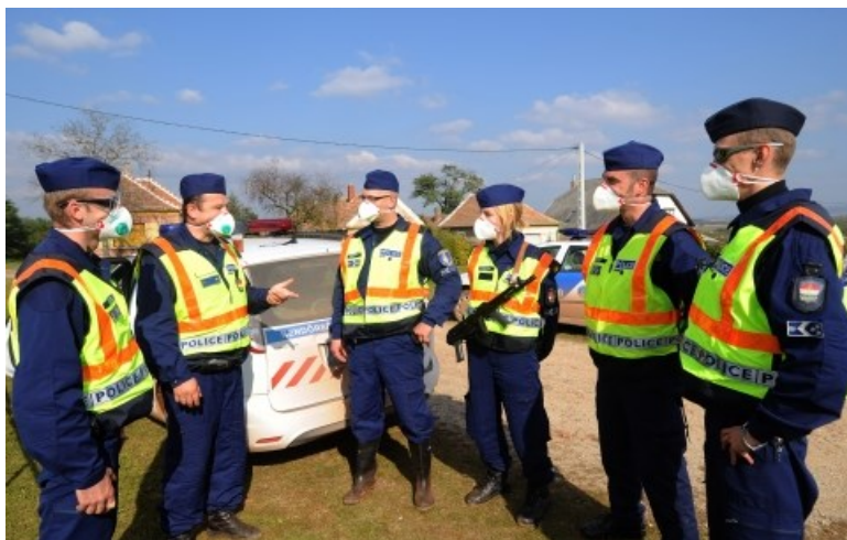
3. ábra: Nyílt terepen, veszélyhelyzetben védőeszköz alkalmazása 18

A rendőrség az Európai Unió más tagállamának kijelölt, rendészeti feladatokat ellátó hatóságával kötött írásbeli megállapodás alapján segítséget nyújthat, illetve segítséget kérhet a nagy tömegeket vonzó események, jelentős rendezvények biztosítása érdekében, valamint a katasztrófahelyzetek vagy súlyos balesetek következményeinek rendészeti kezelésével összefüggésben azáltal, hogy törekszik megelőzni a bűncselekményeket, és fenntartani a közrendet és a közbiztonságot