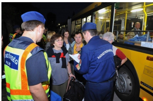
4. ábra: Kitelepítés 21