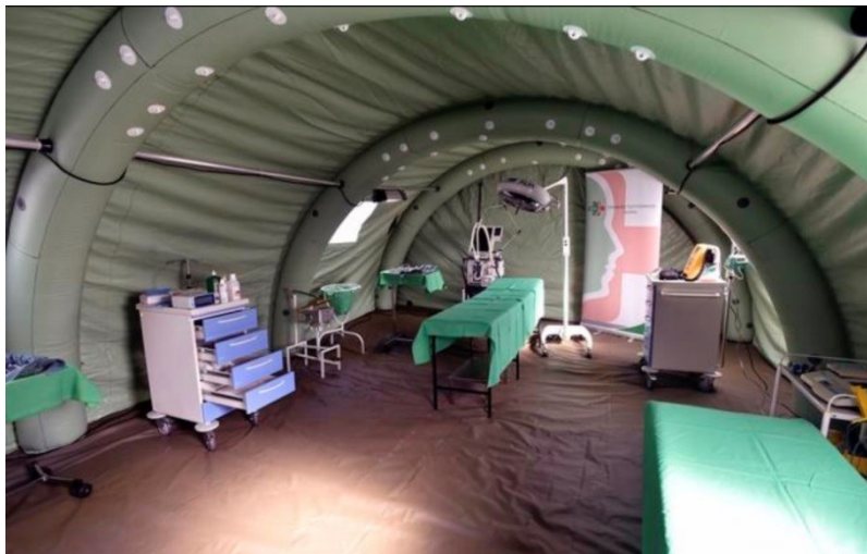
2. ábra: Mobil orvosi segélyhely 14

A Kormány által meghatározott számú időszakosan működő gyógyintézetből az egészségügyi válsághelyzet felszámolásához szükségesek telepítésére a megyei kormányhivatal kezdeményezésére az országos tisztifőorvos egyetértésével az egészségügyért felelős miniszter ad engedélyt a megyei védelmi bizottság elnöke részére és erről tájékoztatja a Kormányt, továbbá az ÁEEK részére elrendeli a készletek kiadásának haladéktalan megkezdését.