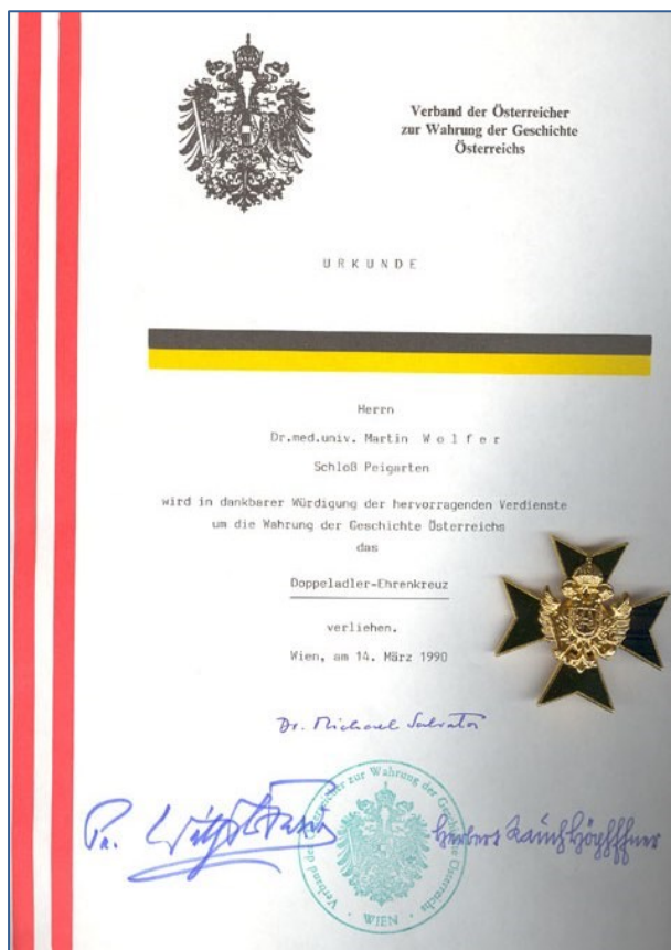
2. ábra: Az osztrák Doppeladler Ehrenkreuz kitüntetés

1991. szeptember 10-én közelgő 90. születésnapja alkalmából meghívták egykori iskolájába, Kismartonba (Eisenstadt Ausztria). Az egykori főreáliskola helyén működő alakulat parancsnoka és katonazenekar köszöntötte. Az ünnepségen jelen volt a Magyar Köztársaság nagykövete, katonai attaséja, az Osztrák Magyar Intézet igazgatója, Dunaharaszti polgármestere és Habsburg Friedrich herceg. Érdemei elismeréseként 1991. március 14-én Doppeladler Ehrenkreuz (Osztrák Becsületkereszt) 28 kitüntetést kapott.