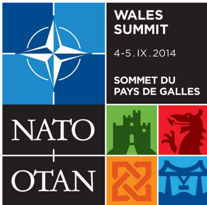
1. ábra: A walesi csúcstalálkozó hivatalos logója