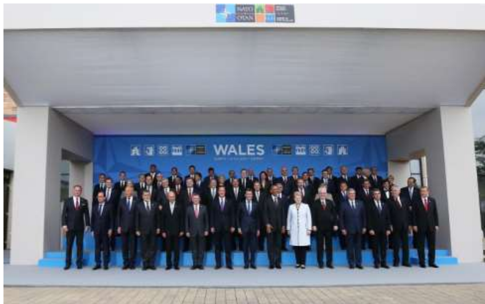
4. ábra: Megnyitó