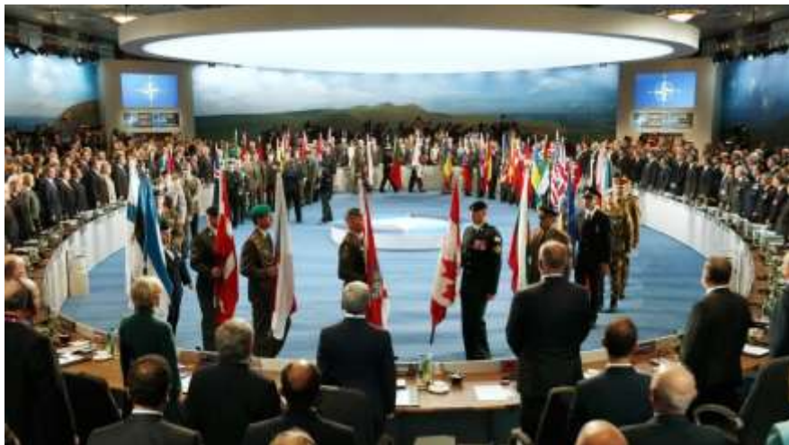
2. ábra: Zászlók felvonultatása a csúcstalálkozó kezdetén