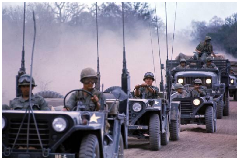
5. ábra. A művelet során ejtőernyős deszant-eljárással földre tett járművek oszlopa

A helikopteres és ejtőernyősdeszantok egyaránt megkezdték támadó tevékenységüket. A hadművelet kezdetén a csapatok – a magas támadási ütem és a sikeres meglepés ellenére – csak kevés észak-vietnámi egységet fedeztek fel. Ugyanakkor támadása során csak a 173. légideszant dandár harccsoportja rövid időn belül az ellenfél hat bázisát számolta fel, jelentős mennyiségű fegyvert, lőszer és ellátmányt megsemmisítve. A légierő napi 170-220 közvetlen támogató bevetéssel segítette a szárazföldi erők harctevékenységét.