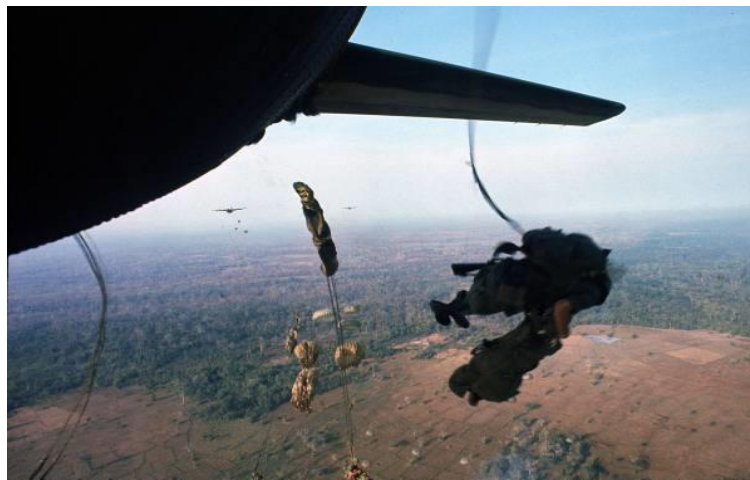
2. ábra. A 173. légideszant dandár katonáinak harci ugrása Katumnál

A vietnami háború során az amerikai haderő 1967. február 22-től május 13-ig összességében hadosztály méretű légideszant erőt vetett be. A műveletekben egy ejtőernyős dandár, két különleges műveleti ejtőernyős zászlóalj, nyolc helikopteres légimozgékony zászlóalj és két repülőgépes légiszállítású zászlóalj vett részt. A kijuttatás a Saigontól északkeletre és északnyugatra elterülő összefüggő célterületekre többségében ejtőernyős deszant-módszerrel történt , ugyanakkor már megjelent a helikopteres deszantok alkalmazása is. Lényegében ez volt a vietnami háború egyetlen nagyszabású ejtőernyős deszant-művelete.