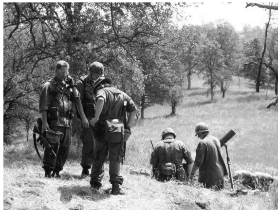
1. ábra. Ejtőernyős aknavetőűteg a Junction City hadműveletben

A második világháborút követően a gázturbinás hajtóművek megjelenése jelentős mértékben átalakította a légideszantok haditechnikai eszközeit, valamint a lehetséges kijuttatási módok körét. A hagyományos ejtőernyősdeszantok mellett – esetenként azokat kiszorítva, korábbi szervezeteket átalakítva – Vietnámban megjelent és kifejlődött a helikopteres légimozgékonyosság. Ugyanakkor tovább fejlődött az ejtőernyős deszantmód is, amely egyre inkább lehetővé tette nehéz haditechnikai eszközök – köztük gép- és harcjárművek – biztonságos kijuttatását.