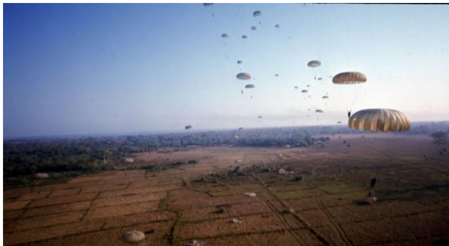
3. ábra. Az ejtőernyős katonák földet érnek a Junction City hadművelet légideszant fázisában

A légideszant és a gépesített egységek február 21-én foglalták el állásaikat. A deszantokat kiinduló repülőtereiken gyülekezették. A 173. dandár ejtőernyős harccsoportja a célterületől távoli Bien Hoa repülőtérre gyülekezett, egyúttal őket deszantolták a kialakítandó bekerítés legtávolabbi pontjára is. A kis hatótávolságú helikopteres deszantoknak közvetlenül a szárazföldi csapatok megindulási terepszakasza mögött – alkalmas terepszakaszon – jelölték ki egy-egy gyülekezési zónát.