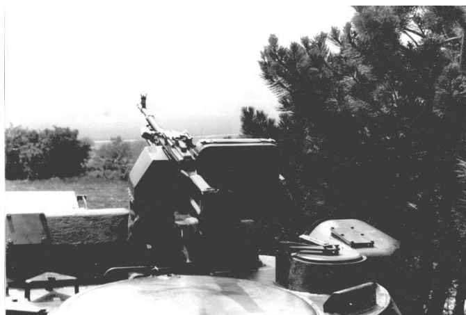
2. sz. kép: 1V14 harcjármű a kombinált parancsnoki figyelőműszerrel képes éjszakai körülmények között is a célfelderítésre és a tűzmegfigyelésre

„A terep megvilágítás alkalmazása minden esetben a parancsnok felelőssége. A vezetést és irányítást a megvilágításra kerülő területen elhelyezkedő manőver erők parancsnoka kell, hogy összehangolja.” 3 A terep megvilágításnak összhangban kell lennie a parancsnok terep megvilágításra vonatkozó elképzeléseivel, és együtt kell működni a szomszédos kötelékekkel annak érdekében, hogy elkerüljük mások elhelyezkedésének, vagy műveleteinek leleplezését, valamint ne akadályozzuk a szomszédos kötelékek csillagfény erősítéses, vagy hőképes elven működő rendszereinek használatát. Az együttműködés megszervezéséért általában a megvilágításra kerülő harcterületért felelős manőver erők parancsnoka a felelős.