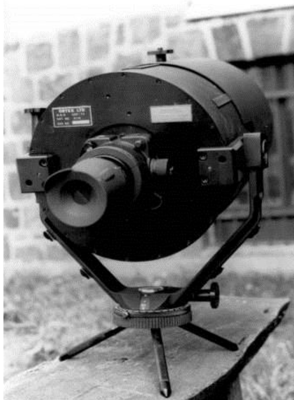
4. sz. kép: ORT-T4 passzív rendszerű éjszakai figyelőműszer