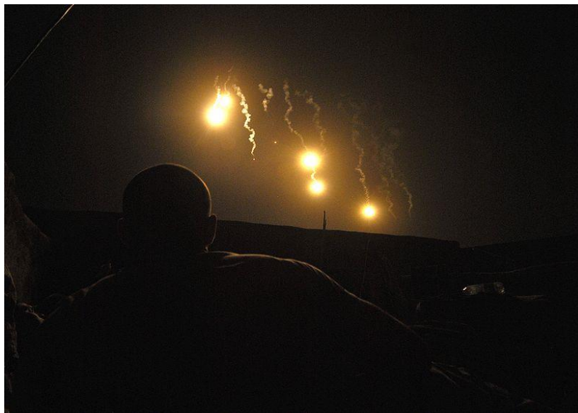
1. sz kép: A terep tüzérségi megvilágítása

A harcmező megvilágításának képessége alapvető fontosságú a célfelderítő és tüztámogató rendszer számára abból a célból, hogy maximális harci erőt koncentrálhassunk az adott területre. Terep megvilágítási igény bármely szinten jelentkezhet.