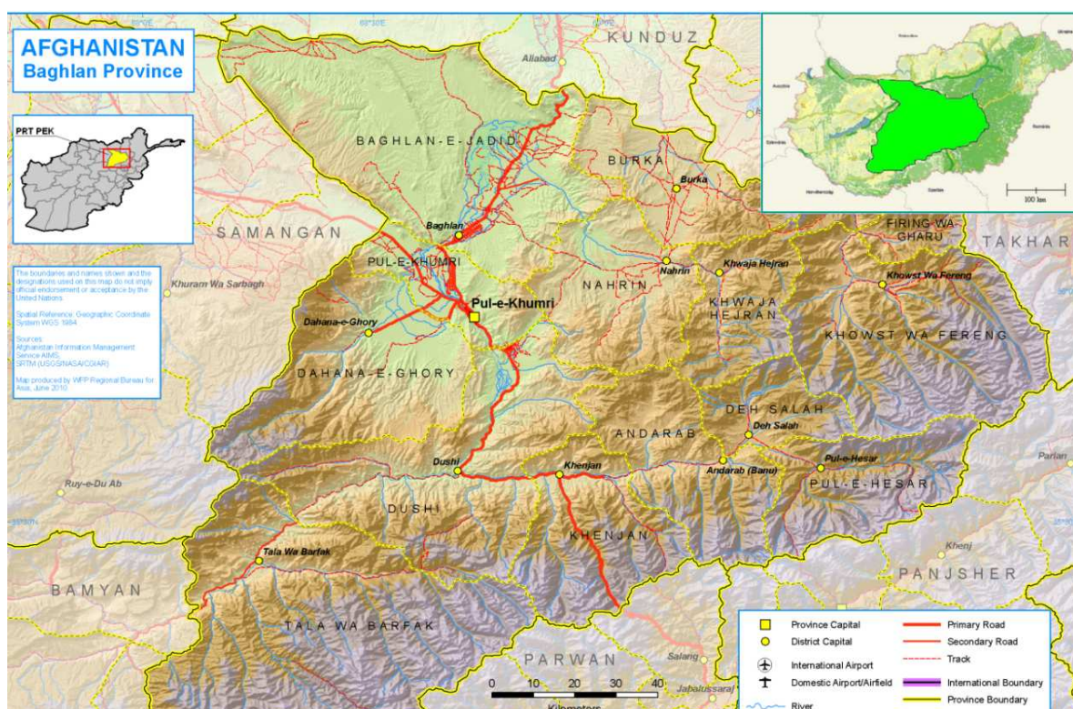
2. ábra: A magyar felelősségi terület

(Szerkesztette: Bokros Tünde Ibolya a World Food Programme térképe alapján)