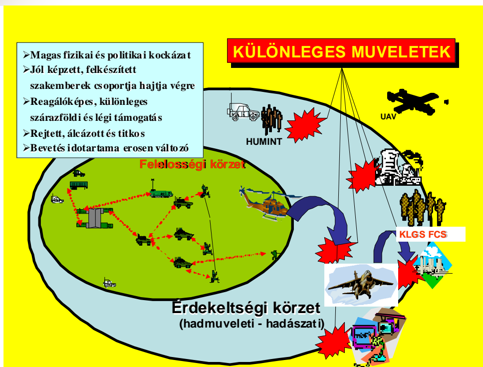
1. számú ábra: A különleges műveletek főbb jellemzői 4

A különleges műveleti erők kategóriájába tartoznak mindazon kötelékek, amelyeknek legalább egyik alaprendeltetési feladata a különleges műveletek végrehajtása, vagy azok közvetlen támogatása. Itt beszélhetünk azokról a kijelölt repülő kötelékekről is, amelyek a különleges alegységek kijuttatására és kiemelésére specializálódtak. Meg kell jegyezni, hogy csupán a repülő kötelékek kijelölése nem elegendő, ezek a szervezetek a különleges alegységek alkalmazási elveiben rögzített viszonyok, körülmények, és módszerek szerint kell, hogy képesek legyenek a csoportokat kijuttatni. Ezek az adottságok a többi hasonló (esetünkben szállító helikopter) alegységtől eltérő felszereltséget és kiképzettséget igényelnek.