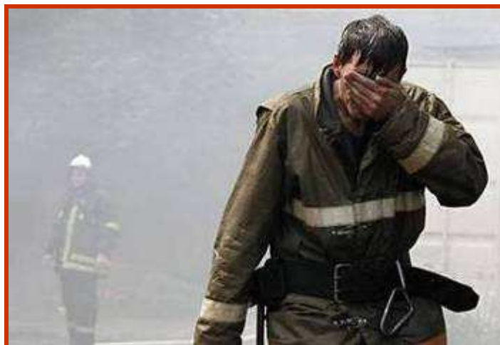
3. sz. ábra: A tűzoltó egészen a kimerülésig küzd a lángokkal, gyakran hiába. Készítette: Tatyana Makeyeva/Reuters, Forrás: 26

Legyél a barátja, sose hagyd magára, a harchoz, melyet vív, légy a hátszága. Erősítsd, bátorítsd, vérted fel a harchoz, Kísérd végig útján, de ne láncold magadhoz!” 25