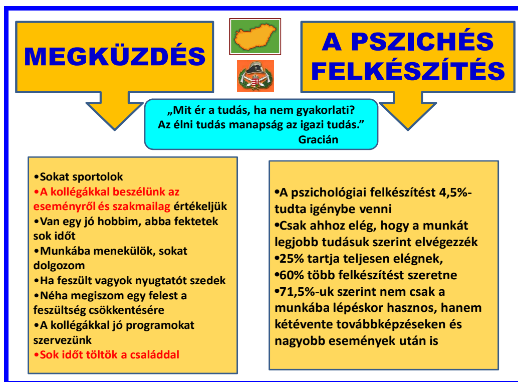
2. sz. ábra: A feldolgozási módok és vélemény a pszichés felkészítésről Készítette: Dr. Hornyacsek Júlia

Az ábrából látszik a közösség összetartó erejének fontossága, a jó munkahelyi légkör szerepe. És látszik, hogy megvan a veszélye annak, hogy helytelen megküzdési módokat választanak. Ennek elkerülésében nagy szerepe lehet a parancsnokoknak, a szolgálatvezetőknek, a csoportnak.