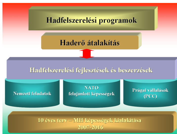
2. számú ábra: Hadfelszerelési fejlesztési programok kapcsolódása