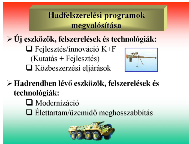
5. számú ábra: A hadfelszerelési programok megvalósítása