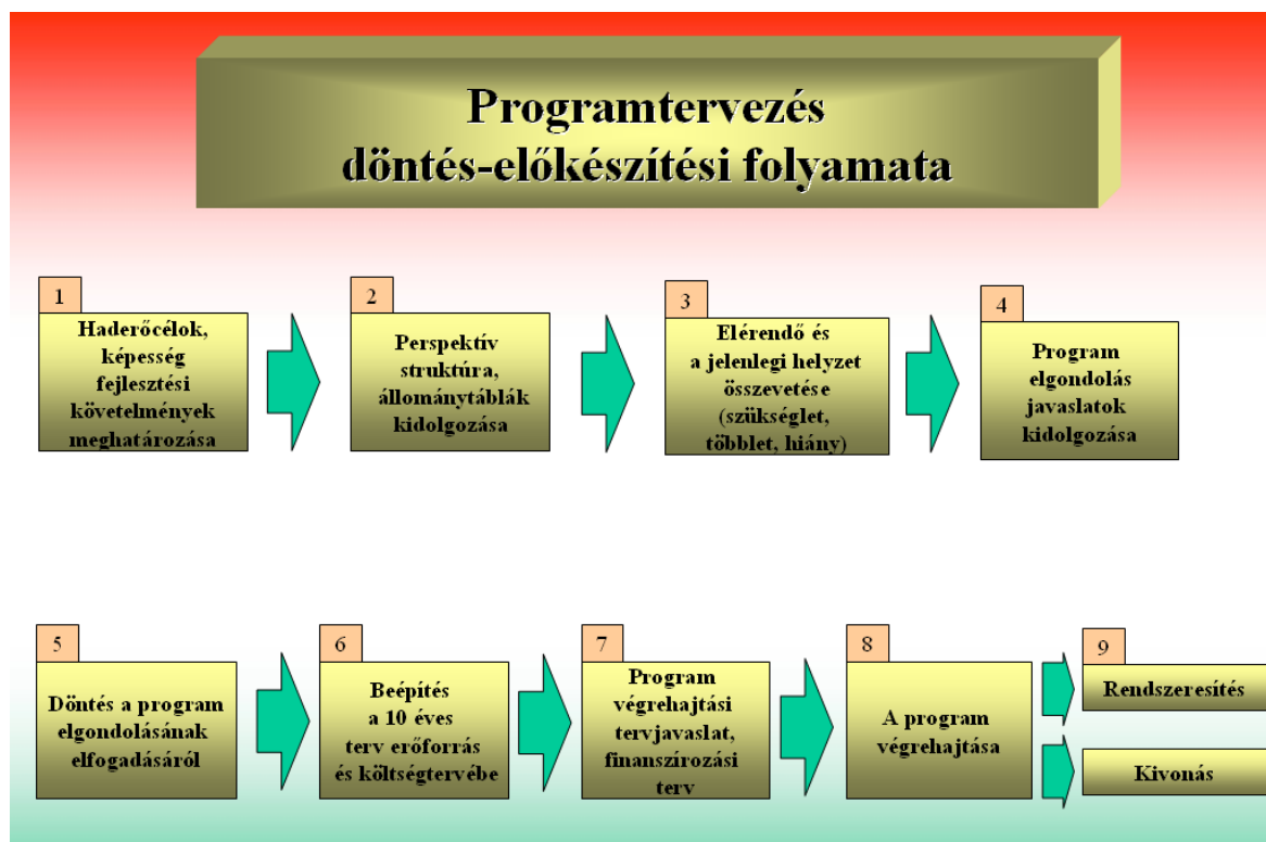
3. számú ábra: A programtervezés döntés-előkészítési folyamata

A program tartalmazza a fejlesztési, beruházási feladat megvalósításának összes folyamatát, teljes életciklusra kivetítve: a fejlesztési, beruházási igény megjelenésétől, a fejlesztési, beruházási cél eléréséig, beleértve a rendszeresítési eljárás lefolytatását, valamint a rendszerbe állítás és a működés-fenntartás induló feltételeinek megteremtésén keresztül a rendszerből történő kivonást is (3. számú ábra).