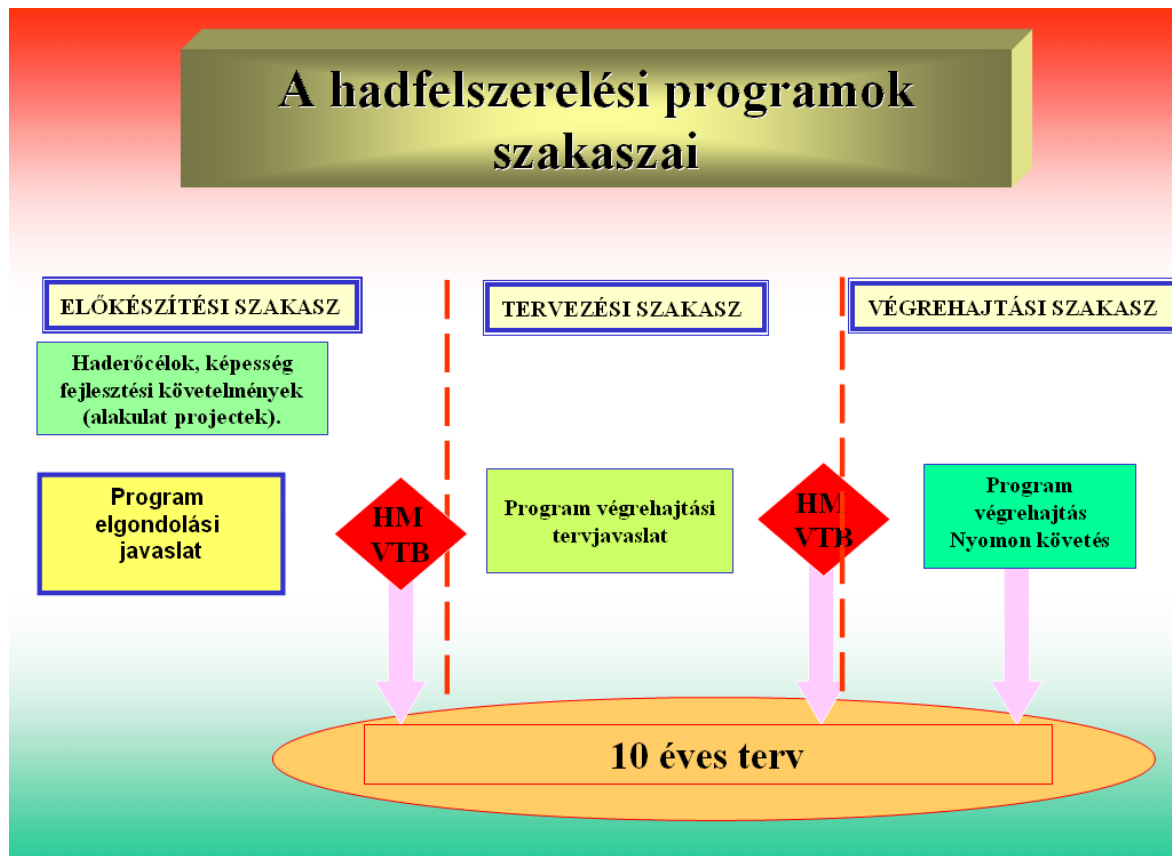
4. számú ábra: A tervezési folyamat

A hadfelszerelés fejlesztési programok előkészítésében, megtervezésében, és végrehajtásában közreműködő szervezetek: