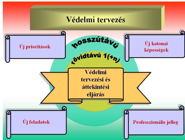
1. számú ábra: A Tárca szintű Védelmi Tervező Rendszer