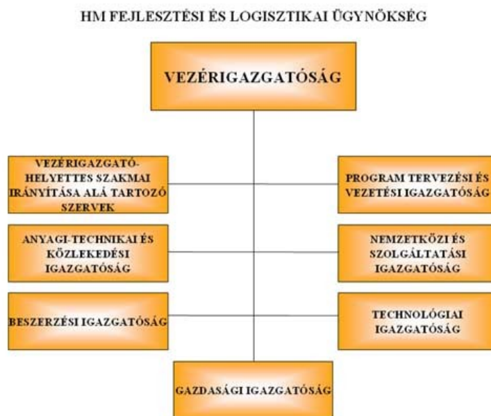
7. számú ábra: A HM Fejlesztési és Logisztikai Ügynökség felépítése

A hadfelszerelés fejlesztési programok tervezése, azok végrehajtása kiemelt feladat és ennek megfelelően kerültek kialakításra a szervezeti keretek is, melyek kellő alapot szolgáltathatnak a fejlesztés, a beszerzések és modernizációra épített képességek kialakításához, ily módon hozzájárulva a kitűzött célok mind teljesebb megvalósulásához.