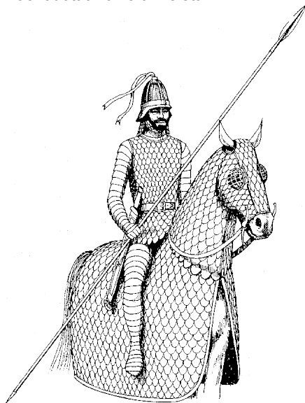
1. számú kép: Parthus nehézlovas

A Szeleukida Birodalom által a Közel-Keleten hátrahagyott hatalmi űrt az i. e. I. század közepére a Parthus Birodalom töltötte be. Maguk a parthusok Közép-Ázsiából származó lovas nép voltak, akik mesterei voltak nemcsak a nehéz, de a könnyű lovas harcmodornak is, amit egymással kiegészítve alkalmaztak. A rómaiak először Crassus vezetése alatt i. e. 53-ban tapasztalták meg a parthus lovasság erejét. Crassus ugyanis megirigyelve triumvirtsai, Pompeius és Caesar hadi sikereit, elhatározta, hogy maga is hasonló babérokra tör, és megtámadja a Mezopotámiában nemrég berendezkedett parthusokat. A támadáshoz segítséget kért Artabazész arméniai királytól, aki „hatezer lovassal érkezett a táborba, de ezek állítólag csak a király testőrei és kísérei voltak; ezen felül saját költségén eltartott tízezer főnyi vértesslovasságot és harmincezer főnyi gyalogságot ígért.” 8 Mint ebből a forrásból is kiténik, az arméniaiak a korban jelentős nehéz lovassággal rendelkeztek. Igaz, az ígért segítség soha sem érkezett meg Crassushoz, így saját csapataival, azaz mintegy 43 ezer emberrel vágott bele a hadjáratba. Vállalkozása azonban katasztrófába torkollott, ő maga és fia is holtan maradt a carrhaei csatatéren, ahol a mintegy 10 000 főt számláló parthus haderő diadalmaskodott a rómaiak felett.