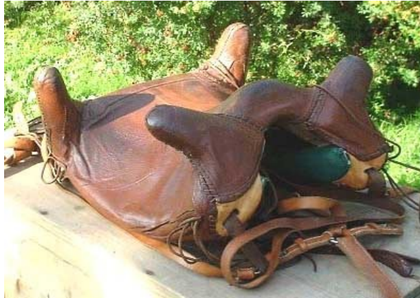
3. számú kép: Ókori nyereg rekonstrukciója

A kísérleti archeológia bebizonyította, hogy a több ókori nép által használt négyszarvú nyereg megfelelő stabilitást biztosított a lovasnak arra, hogy lándzsájával ökleljen, vagy oldalra dőlve lehajoljon anélkül, hogy leesne a lováról. 27 Ilyenformán már a késő antikvitás nehézlovasai is rendelkeztek azokkal a képességekkel, amelyek révén csatalovasságként lehetett őket alkalmazni. De hogyan is vélekedtek erről akkoriban?