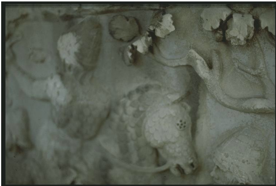
2. számú kép: Szarmata páncélos lovas ábrázolása a Trajanus oszlopon

hézlovas alakulat, amit a rómaiak maguk állítottak fel és integráltak hadszervezetükbe, alkalmazkodva a körülményekhez.