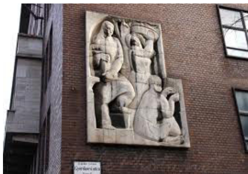
MTESZ Oktató és Tanácsadó Központ, Bp. Fő u. 68.

Társaságunk megalakulását (1961.) követően a MTA keretében működött, majd 1977. április 24-től a MTESZ keretében folytatta működését.