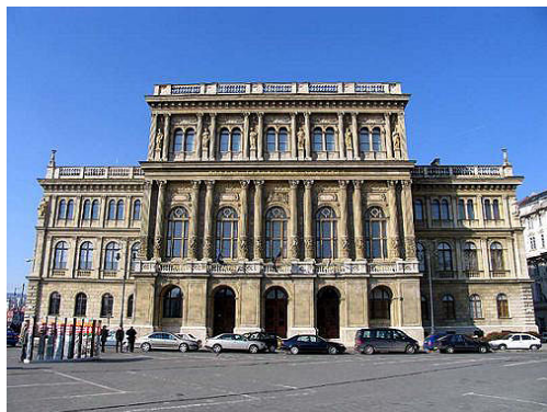
MTA Székház, Bp. Széchenyi István tér 9.