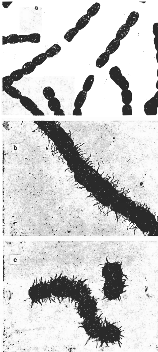
Abb. 1. Elektronenmikroskopische Aufnahmen über maturierte Sporenketten aus dem Regenwurm-Darm isolierter Streptomyces -Stämme. a: Stamm EL-272 ( S. levoris ), glatte Sporen (8000 \times ); b: Stamm AR-31 ( S. sp. ), Sporen mit langem Stacheln und haarigen Auswüchsen bedeckt (8000 \times ); c: Stamm OM-227 ( S. prasinus ), stachelige Sporen (8000 \times )

mässige Verteilung der Arten im Darminhalt, da die Isolation nicht auf selektiver, sondern „randomierter“ Weise durchgeführt wurde. Es ist auffallend, dass im Darminhalt konsequenter Weise immer 1 oder 2 Arten dominierten, viele andere nur eine untergeordnete Rolle gespielt haben. So z.B. bei Eisenia lucens S. olivaceus (73% der Gesamtaktinomyceten-Population), bei den juvenilen L. poli-