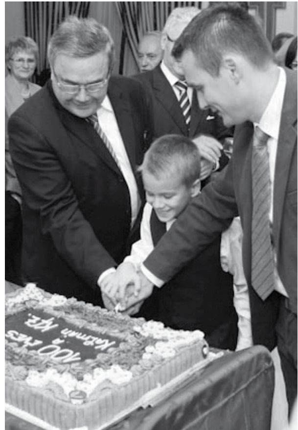
A centenáriumi torta felvágásából már a legfiatalabb „Kálmán-generáció” is kivette a részét

Alapelképzés a magas igényű, tölgyfából készült bútorok és lakberendezési tárgyak forgalmazása, új és fiatal tervezők, designerek felfedezése és támogatása, aktív bekapcsolása a modern és esztétikus bútorkészítés és lakberendezés világába.