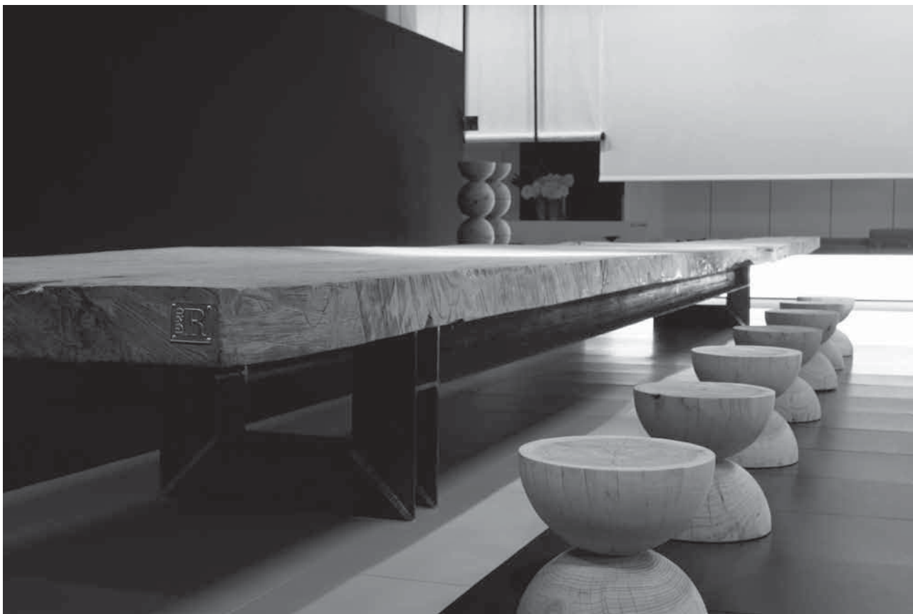
1. kép Mario Botta: Asztal ülőkékkel (Riva)

Az elmúlt években – a globális felmelegedés már mindennapjainkban is érzékelhető káros hatásai következtében – a gazdaságban mind nagyobb hangsúlyt kaptak a környezetvédelem szempontjai. Ez a szemléletváltás a bútorgyártásra is hat. S nem csupán a műanyag-technológiák fejlődnek: ma már a plasztikból készült tárgyak jó része is lebomlik. Nem lehet nem észrevenni, hogy nő a reciklikus