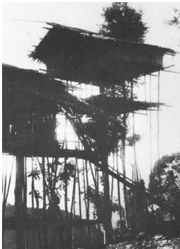
3. ábra – Építészet építésszek nélkül – a kiállításon szereplő egyik felvétel

Az Encyclopaedia of Vernacular Architecture of the World (A világ népi építészetének enciklopédiája, 1997) az alábbi meghatározással indít: