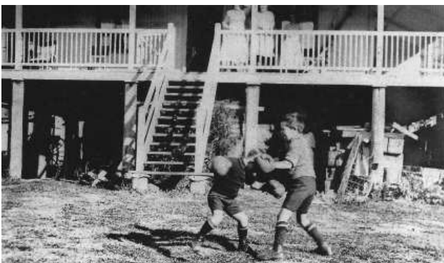
2. ábra –Élet a Queenslandi ház udvarán

előrehaladott stádiumban volt, nagy mennyiségű bizonyítékot feltárva az „objektív” nézet alátámasztásához.