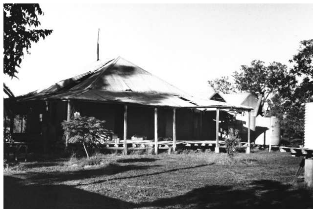
4. ábra – Queensland népi építésze

Vitatható, hogy csak a jómódúak privilégiuma lenne-e, hogy „megszokott és divatos”