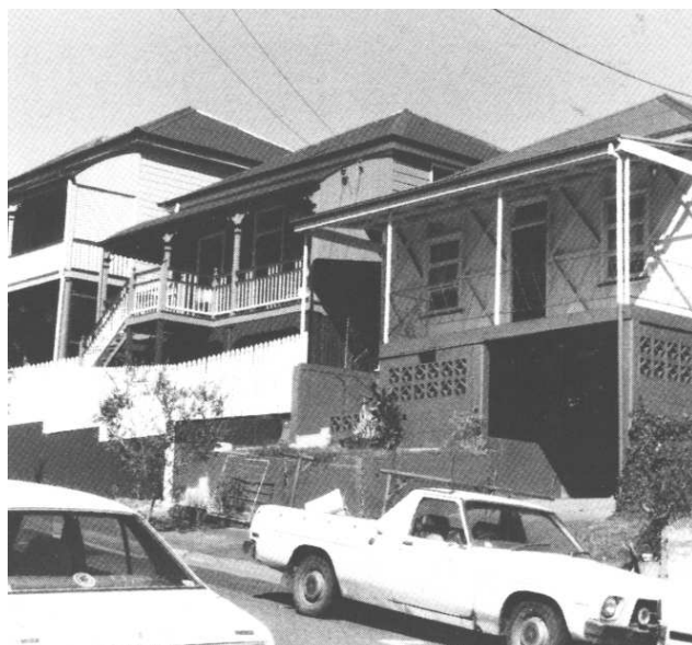
5. ábra – Munkásotthon a második világháború előttről Brisbane-ben

környezetet teremtsenek, de annyi bizonyos, hogy ők voltak azok, akik ezt finanszírozni is tudták. A népi építészetet így az alacsony jövedelműek szerény otthonaival azonosították, akik Queenslandben abban a kiváltságban részesültek, hogy családi házakban lakhattak, de nem engedhettek meg maguknak mutatós lakhelyeket (5. ábra). Ezek az állítások azt feltételezik, hogy a queenslandi ház az első „rusztikus” ideiglenes épületek fokozatos fejlődésének eredménye. Ennek a fejlődésnek a fő állomásait Rod Fisher a Brisbane-i Történelmi Társaság kiadványában vázolta fel először, és majdnem egy évtizeddel később a The Queensland House: a roof over our heads (A queenslandi ház: tető a fejünk fölött, 1994) című általa szerkesztett könyvben publikálta részleteiben.