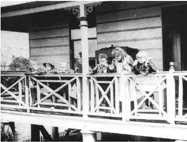
1. ábra – Élet a Queenslandi ház verandáján...