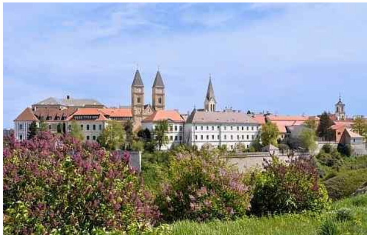
1. ábra Veszprémi vár

Öt-hatezer évvel ezelőtt az utolsó jégkorszakot követő melegedéssel népesült be lassan a mai város területe. Ebből az időszakból különböző használati tárgyak, így kőeszközök és vonalakkal díszített edények kerültek elő. A bronzkorban már földműveléssel foglalkozott a lakosság. A bekarcolt és mésszel kitöltött díszítésű edények legkorábbi lelőhelye Veszprém volt. Később az ókori Pannónia római tartomány felső részéhez tartozott a város. Ekkor már általánossá vált a mezőgazdasági gazdálkodás. Így alakult ki Veszprémtől 7 km-re, Nemesvámos mellett a Baláca-pusztai villa-gazdaság. Római kori neve Caesariana volt. Ebben az időben már éltek Pannóniában zsidók. Ebből a korból a város környékéről már héber feliratú sírkő került elő. ( 3 ).