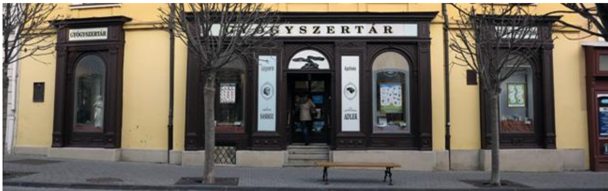
4. ábra Fekete Sas gyógyszertár