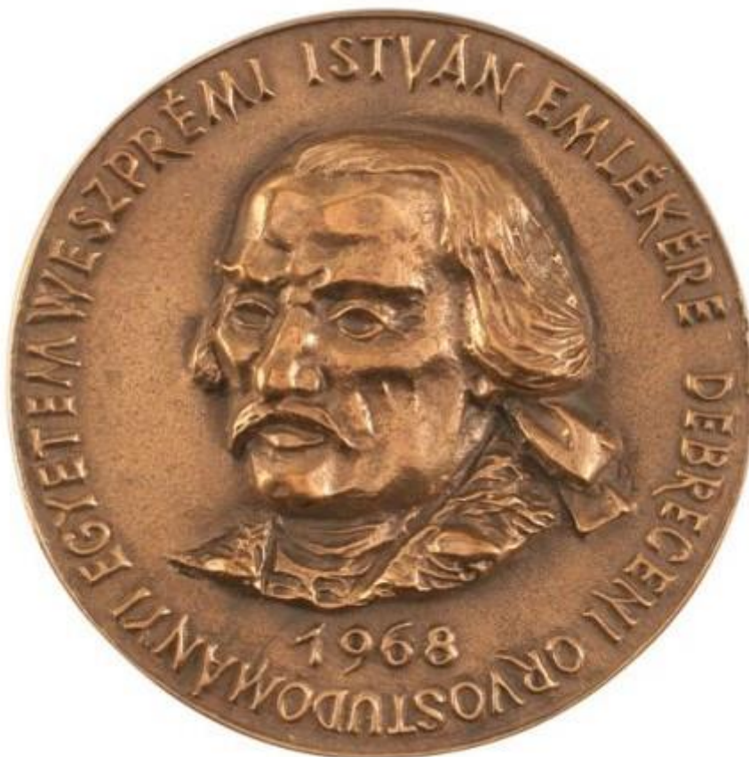
9. ábra Weszprémi István

Weszprémi István (Veszprém, 1723. VIII. 13. - Debrecen, 1799. III. 13.)