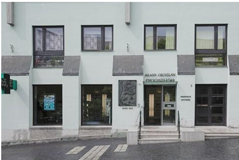
6. ábra Arany Oroszlán patika