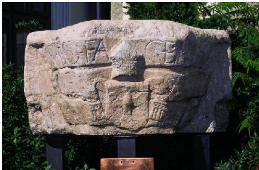
3. ábra Vetési kő

A XV. században három ispotály működött Veszprémben. 1416-ban a Szent Margit-szeg városrészben a káptalannak külön fürdője volt. 1. Boldogságos Szűz ispotály: Vetési Albert püspök alapította a káptalannak. Egy fürdőjük is volt szegényeknek. – 2. Szent Katalin ispotály: 1475 – 3. Szent Erzsébet ispotály: 1484 ( 10, 11 ). Az ispotály nemcsak kórház, hanem csak ápolást igénylő menedékház volt.