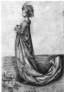
Felisómet művész 1472-ből: Eldőkező nő Tollrajz