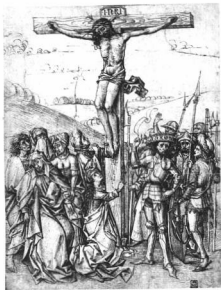
Nürnbergi művész, 1480 körül: Jézus a kereszten. Tollrajz