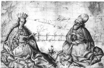
Witz, Conrad (meghalt 1454-ben): Szűz Mária a gyermek Jézussal és Szent Pállal. Tollrajz