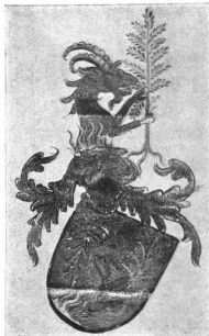
A MECSINCSEI GARAZDA- ÉS A HOROGSZEGI SZILÁGYI-CSALÁD CÍMERE. 1409, febr. 24

Vannak, akik a heraldikát elavult, a mai kor szellemével össze nem egyeztethető, haldokló vagy éppen meghalt tudománynak tartják.