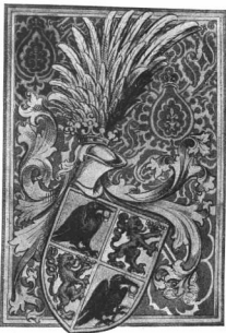
HUNYADI JÁNOS BŐVÍTETT CIMERE 1453, febr. 1

A címeresleveleken kívül még címerek díszítik a könyveket is. Festett címerek vannak a Corvin-kódexekben, Thurzó imádságkönyvében, Perényi Ferenc váradi püspök missalejában, stb.; a címeralbumokban, címeres emlékkönyvekben. Metszeteken és arannyal nyomott ú. n. superexlibriseken. Selyemre festett halotti címerek is láthatók a kiállításon, de ezek csak a XVIII. század végéig nyúlnak vissza.