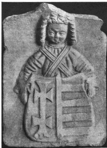
KALYHACSEMPE A XVI. SZÁZAD ELEJÉRŐL Orsz. M. Iparművészeti Múzeum