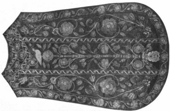
MISERUHA GURABY MATYÁS CIMERÉVEL. Magyar, XVII. sz. Győri székesegyház tulajdona