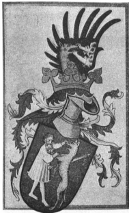
A KISTÁRKÁNYI-CSALÁD CIMERE. 1434, dec. 23

ben ünnepl, melyet az Iparművészeti Múzeumban rendezett, ez már magábanvéve bizonyítéka a címertan és a művészet között való összefüggésnek.