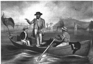
STERIO KÁROLY (1821—1862): GRÓF SZÉCHENYI ISTVÁN ES FIA. Kőnyomat