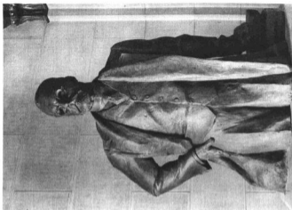
KISFALUDI STROBL ZSIGMOND; TISZA ISTVÁN