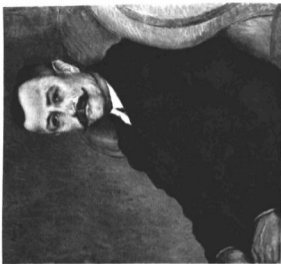
RIPPL-RONAI JOZSEF (1861—1927): NAGYATADI SZABÓ ISTVAN