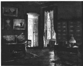
PARLAGHI VILMA (1864—1923): KOSSUTH LAJOS TORINÓI DOLGOZÓSZOBAJA