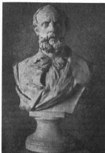
KISS GYORGY (1852—1916): SZENTKIRALYI MORICZ

Rippl-Rónai Józsefet, az arckép terén is gazdag szépségű új világot hozó művészt Nagyatádi Szabó István képmása képviseli a gyűjteményben. Pasztelkrétáinak nyelvén 1918-ban örökítette meg az újkori politikai élet országos híru alakját, a földművesnép parlamenti vezérét. Ligeri Miklós több művel szerepel, köztük az államférfinak és műfőnőnek is nagyszabású egyéniség, ifjabb