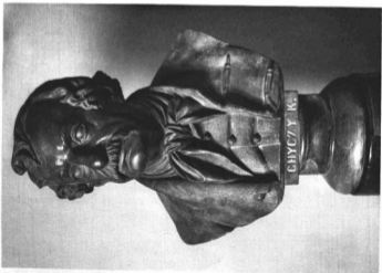
IZSO MIKLÓS (1831—1875); GHYCZY KALMÁN