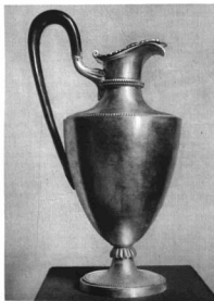
KANNA. KAMECKER SAMUEL SOPRONI ÚTVOS MŰVE. 1795. Mag. 28 cm Az Orsz. M. Iparművészeti Múzeum új szerzeménye