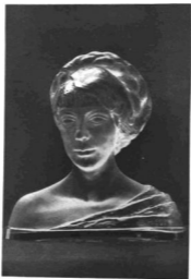
HIESZ GÉZA : NŐI TANULMANYFEJ. Kristályüveg. 1926 Kiállítva a párizsi Salon des Tuileries-ben, 1928-ban