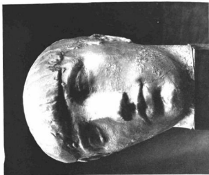
CHARLES DESPIAU : FEJTANULMÁNY