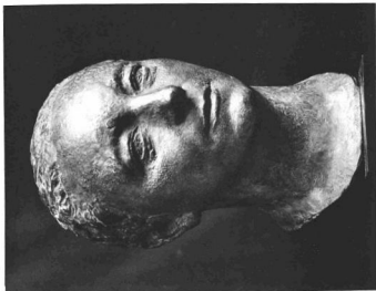
CHARLES DESPIAU: B. ASSZONYI KÉPMÁSA