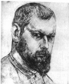
CHARLES DESPIAU ÖNARCKÉPE. Rajz, 1907