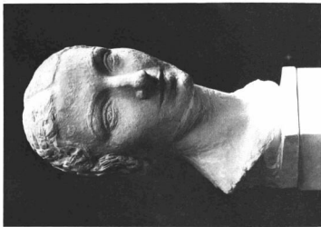
CHARLES DESPIAU : BIANCHINI K. A. MELLISZOBIRA