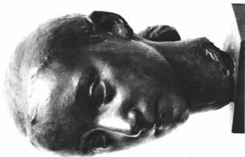
CHARLES DESPIAU: FIATAL LEÁNY KÉPMÁSA Luxembourg museum Paris