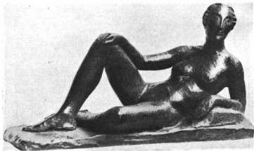
CHARLES DESPIAU: FEKVŐ NŐ