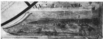
BUDA LÁTKÉPE 1687-BŐL

A lap két alsó sarkát két városkép tölti ki. Baloldalon van Bécs városának lát képe, a jobboldalon pedig Budé. Felírása: Suppressus turca Buda expugnata altera Septembris . Tehát 1687-ből való, mely évből nem ismerünk Buda-lát képet sem metszet, még kevésbé festmény alakjában. E korból származó német és olasz metszetek Budát főként ostromoit állapotban ábrázolják, de ha nem, akkor is erődtényeit, bástyaszorú jellegűt hangsúlyozzák. Ilyen már az 1602-ben készült Zimmermann-féle metszet, a későbbi korból pedig Wussim és Ifj. M. Merian