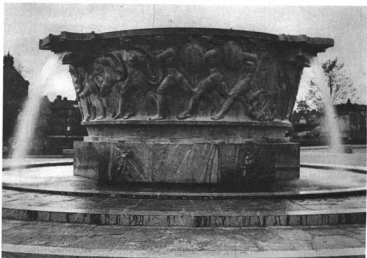
MILLES, CARL: DÍSZKÚT

Felállították 1926 október havában Stockholmban a Műegyetem előtt