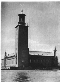
A STOCKHOLMI VÁROSHÁZ