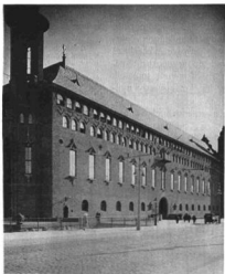
A STOCKHOLMI VÁROSHÁZ ÉSZAKI FRONTJA

Középen a főkapu; jobbra a nagytorony; balra lejáró a Bellman-pincébe