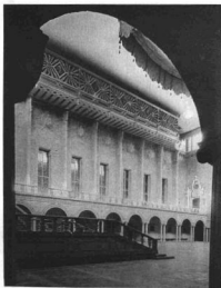
A STOCKHOLMI VÁROSHÁZ A KÉK CSARNOK AZ ERKÉLYVEL