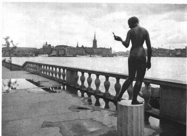
TORÉ STRINDBERG SZOBRA: CROCUS A VÁROSHÁZ KERTJÉBEN