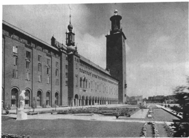
A STOCKHOLMI VÁROSHÁZ DÉLI FRONTJA