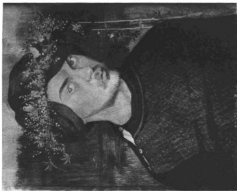
ARONILIS, IVAR : ÖNARPKÉP Nemzeti Múzeum, Stockholm