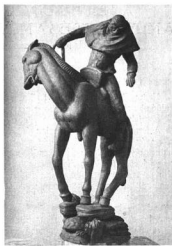
MILLES, CARL: KÚTFIGURA Lindhöping. Folkungsköt