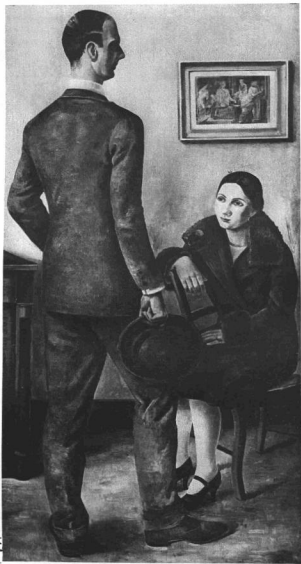
SKÖLD, OTTE: KETTŐS ARCKÉP Göteborgi múzeum