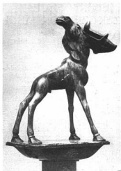
MILLES, CARL: JÁVORSZARVAS