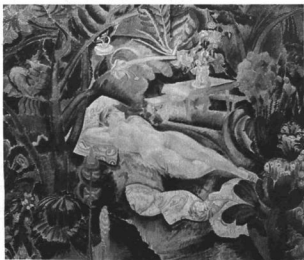
STEN, JOHN: ALVÓ NŐ A KERTBEN Nemzeti Múzeum, Stockholm