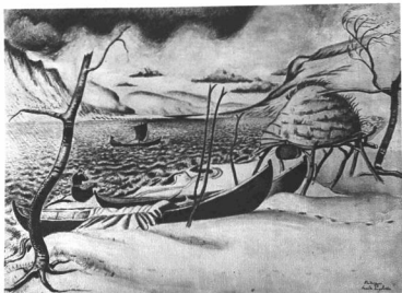
ENGSTRÖM, LEANDER: A LAPPOK FÖLDJÉN