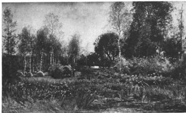
TÖRNÅ, OSCAR (1842–1894): A LOING FOLYÓ MELLETT Nemzeti Múzeum, Stockholm