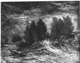
HILL, CARL: TÁJKÉP. 1875

mányainak elvégzése után 1870-ben, legyőzve atyjának heves ellentállását, sikerült neki Stockholmba utaznia, hogy ott a Kir. Művészeti Akadémián egyedül a festészettel foglalkozzék. Itt maradt 1873 tavaszáig. A tanítás bizony annak idején nagyon kezdetleges volt és Hill különben sem érezte jól magát új környezetében. Heves, ingerlékeny természet volt, aki könnyen konfliktusba keveredett úgy tanáraival mint társaival. Minden vágya Páris felé vonta. Hílte, hogy ott művész lehet belőle. Oda is érkezett 1875 őszén és ott tartózkodása, leszámítva az 1875 nyarán történt kisebb megszakítást, egészen 1881-ig tartott. Ez idő alatt azonban Hill három évig idegbeteg volt s mint ilyen a passyí Maison de Santé-ben ápolták. Véletlen szerencsétlenség — egy atelierrablak zuhant a fejére — siettetta a betegség kitörését. Végül elhagyhatta Franciaországot és visszatérve szülővárosába, állandóan ott tartózkodott 1911. évben bekövetkezett haláláig.