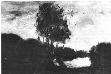
HILL, CARL : TÁJKÉP