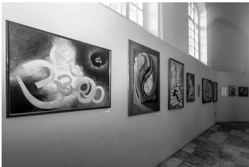
Részlet a kiállításból

A korai évekből egyetlen megmaradt, „Budapest 922” jelzésű Tabán képének expresz-szív ecset- és színkezeléséről, kiváló festészeti képességeiről oldalakat lehetne írni. Itt most csak annyit, hogy Hamza láthatóan a természetelvű látványszemlélettől indult. Tudjuk – bár itt nem találunk példát rá – szociális tartalmak kifejezésére a későbbiek során többször oppo-nált naturalista felfogású képekkel is. Portréinál is a realista ábrázolást alkalmazta.