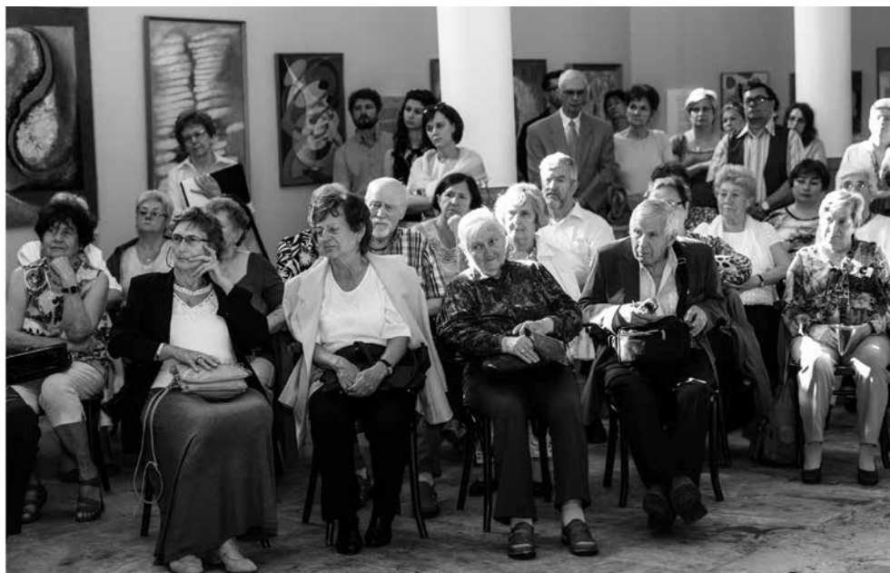
A megnyitó közönsége.