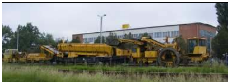
Lokális hibaelhárító géplánc a gyár főépülete előtt

A Kft. életében jelentős változás következett be a 2005. évtől. Az eddigi nagygépes vasúti vágányszabályozás, gépjavítás-gépgyártás, alkatrészgyártás mellett meghatározó tevékenységgé vált – a MÁV ZRt. által kezelt közforgalmú vasúti pályahálózaton – a jól tervezhető karbantartási és felújítási tevékenység végzése, Buda-