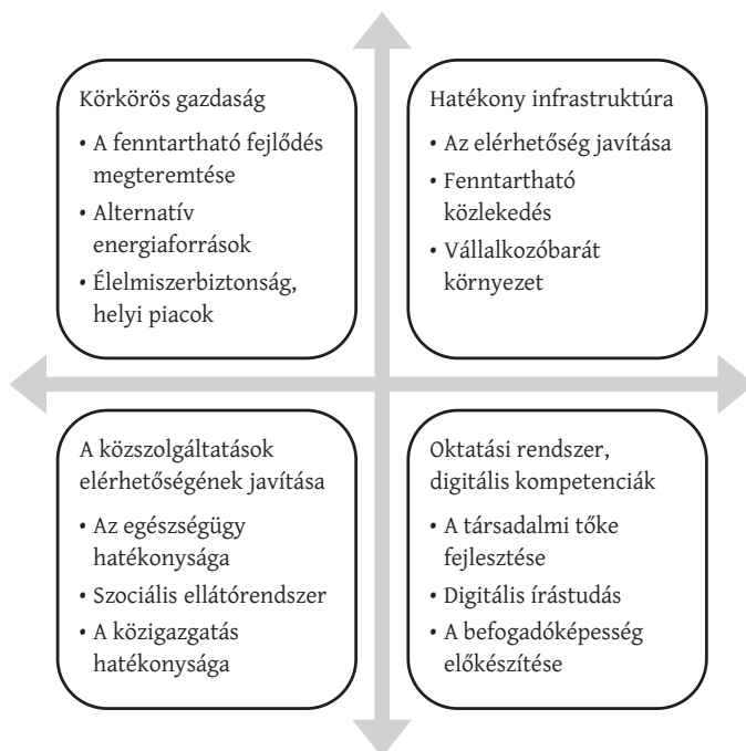
3. ábra: A hazai smart vidékstratégiák megvalósításának építőkövei The basics of implementing smart rural strategies