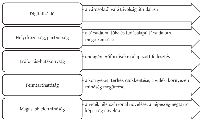
2. ábra: A smart falu koncepciója és céljai The concept and goals of the smart village

kelet-közép-európai gazdasági-társadalmi-földrajzi miliőben mit jelent a smart falu, hiszen ennek segítségével alakítjuk a fejlesztések főbb irányait. Értelmezésünk szerint a smart falu olyan modellértékű fejlesztések összessége, ahol kellő áttekintéssel kezelik a technológiai fejlesztéseket, amelyeket beépítenek a mindennapi tevékenységek rendszerébe, ahol az intelligens fejlesztések gyors fejlődést eredményeznek az egészségügyben, az élelmiszer-termelésben, az oktatásban, a közigazgatásban, a gazdasági életben, a társadalmi jólétben. A fejlesztések hatására a vidéki lakosság számos olyan előnyben részesül, amelyek a városi élet szolgáltatásai mellett a vidéki élet értékeinek megtartásával, kiegyensúlyozott jólét biztosításával valósulhatnak meg, jelentősen csökkentve az urbánus és a rurális élettér közötti különbségeket. A megfogalmazott smart fejlesztési megoldások a vidékgazdaság bővülésén keresztül a fenntartható fejlődést, a támogatások abszorpciók képességének növelését, a kutatás-fejlesztési potenciál növekedését és a tudásbázis bővülését is eredményezhetik, így segítve a térbeli gazdaság folyamatos és fenntartható növekedését.