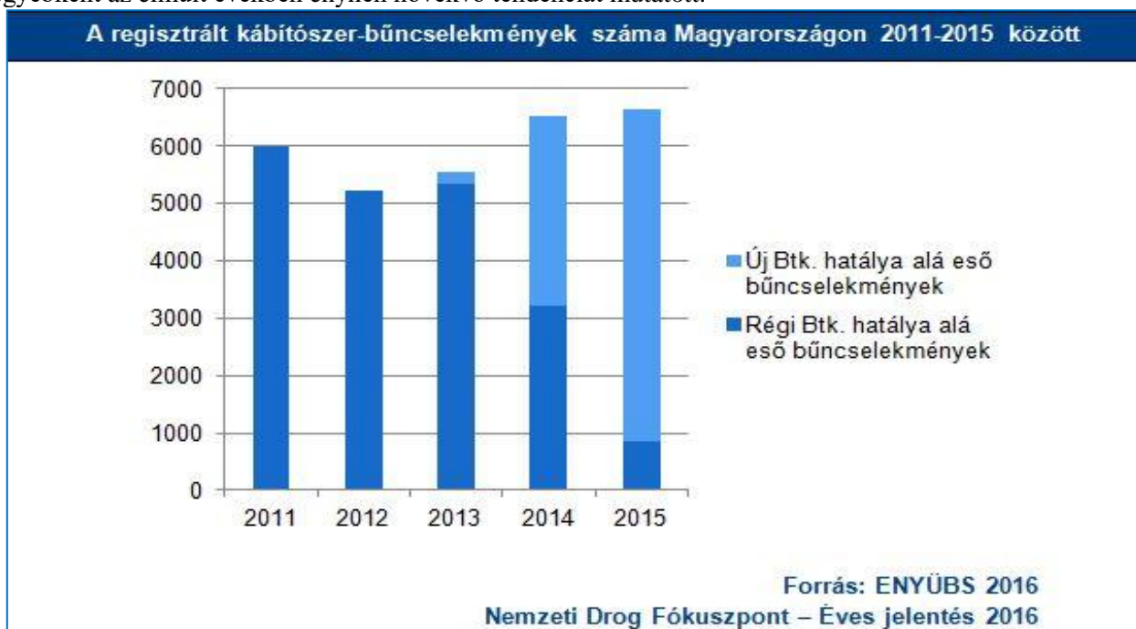
3. ábra: Regisztrált Kábítószer-bűncselekmények száma Magyarországon 2011-2015 között 5

Az új Btk. hatályba lépését követő években jelentős számban folytak olyan büntetőügyek, amelyekben még a régi Btk.-t kellett alkalmazni. 2015-ben a kábítószerhez köthető bűncselekmények a 2,4%-át tették ki az összes hazánkban regisztrált bűncselekménynek. A 2016-os kábítószer jelentés adatai szerint 6625 kábítószerhez vagy új pszichoaktív anyaghoz köthető bűncselekmény miatt indult nyomozás került lezárásra, melynek 12%-a még a régi Btk. hatálya alá tartozott. A regisztrált kábítószer-bűncselekmények száma egyébként az elmúlt években enyhén növekvő tendenciát mutatott.