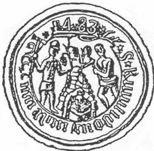
7. Nagybánya 1483. évszámmal ellátott pecsétje (Palmer K., i. m.).