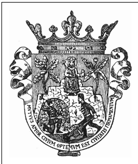
4. Nagybánya címere (Palmer K., i. m. 39. old. 11. ábra.).