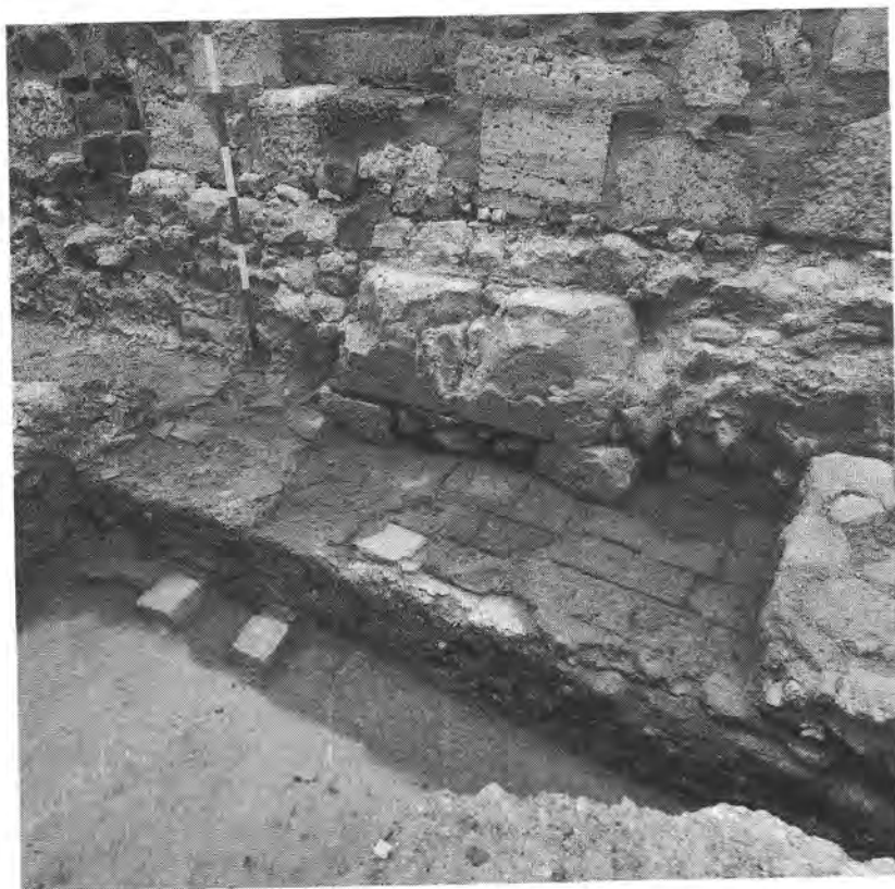
Ásatás a Színház köz területén