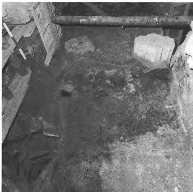
Ásatás a Sándor-palota 46. helyiségében