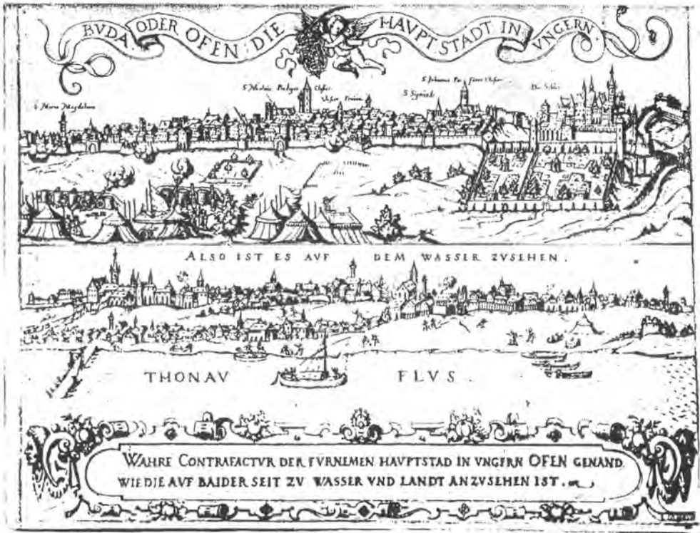
Sibmacher: Buda ostroma 1598–1602 körül