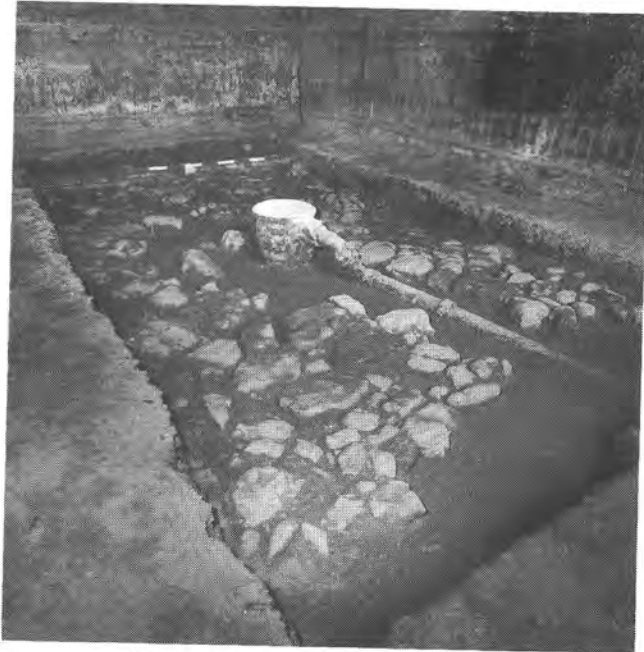
Ásatás a Sándor-palota 17. helyiségében