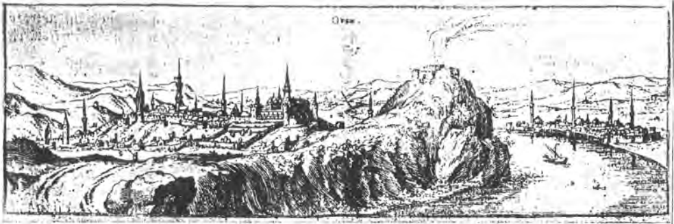
Dilich: Buda és Pest látképe, 1606