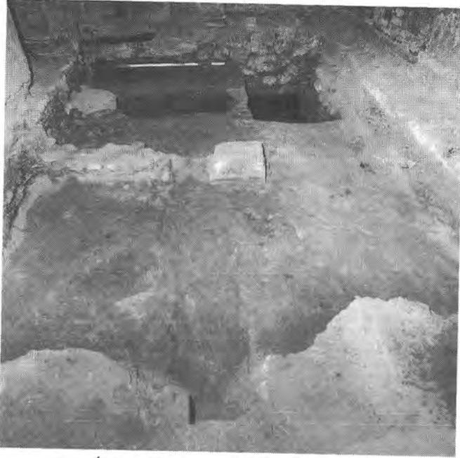
Ásatás a Sándor-palota 48. helyiségében