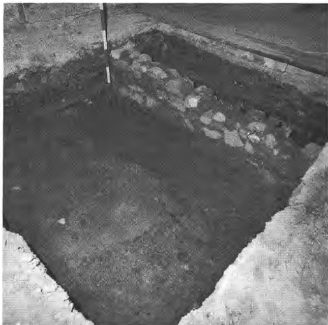
Ásatás a Sándor-palota 47. helyiségében