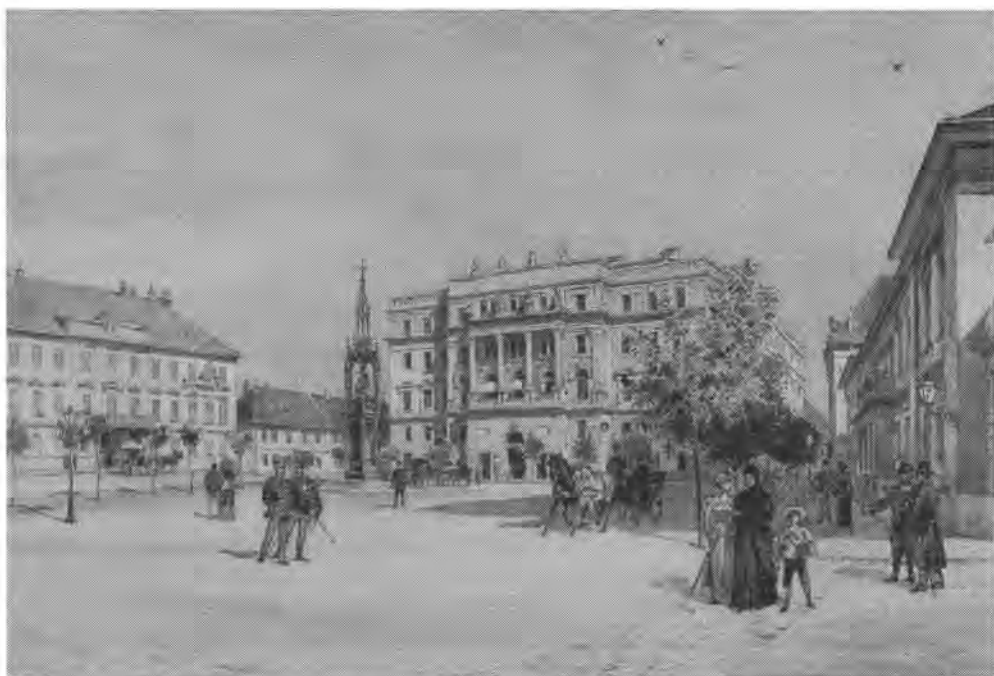
Dörre Tivadar illusztrációja „Az Osztrák-Magyar Monarchia írásban és képen” című kötethez

melynek kapuja elé szolgál a gözszikló. A régi Pallavicini-ház ez, melyet a kormány ily országos célra vásárolt meg. Ezután következik a színház, mellette sorban a katonai hivatalok, majd a Ferencz-József-kapu, melyből gyalog- és kocsit visz le a Lánczhíd-térre. A vár e része alatt, fölötte az alagút torkolatának, van egy árnyas tér, az úgynevezett ellipsz, kedves helye a sétáló közönségnek; felséges kilátás nyílik innen a lánczhídra és környékére. A honvédelmi, a pénzügyi és a belügyi miniszteriumok vannak még a várban, meg a királyi palota szomszédságában József főhercegnek honvéd parancsnoki palotája.” Az illusztráció jóval jelentősebb, mint e rövid szövegrész; Dörre Tivadar (1858–1932) egyike volt a kiadványsorozatban legtöbb rajzot készítő művészeknek. Az általa készített tusrajzot a könyv számára Morelli Gusztáv fába metszette és sokszorosította. A korábbiakhoz képest szokatlan képét láthatjuk a térnek: az eddig hangsúlyosan bemutatott épületek alig azonosíthatók, oly kevés látszik belőlük, a tér közepén még mindig fontos látképi elem az emlékmű, de a kompozíció legjelentősebb és legnagyobb teret követelő eleme a Honvédelmi Minisztérium eklektikus palotájának tömbje.