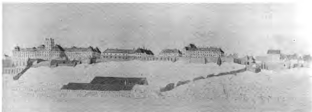
Henry Swinburne: Buda látképe, 1789. (Magyar Nemzeti Múzeum MTKCs 84.36.)

Az 1686-os ostrom után a királyi palota és a polgárváros közti térség romokkal volt tele: lakóházak, főúri paloták, valamint a Szent Zsigmond-prépostság és a ferences kolostor épületmaradványaival. A stratégiai fontosságú területet ekkor a katonaság vette birtokba. Míg a Hauy-alaprajz még többnyire a középkori, török kori állapotokat tükrözi a tér kiterjedésével, egy évtized múlva, az 1696-os Zaiger felvételének idejére a korábbi szabad telkeket is kiosztották. 1