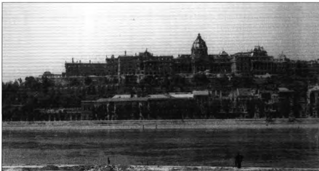
A romos Budavári Palota, 1945. Ismeretlen felvétele. BTM Kiscelli Múzeum, lt. sz.: F.2000.39., neg. sz.: 28.618/6 × 9.