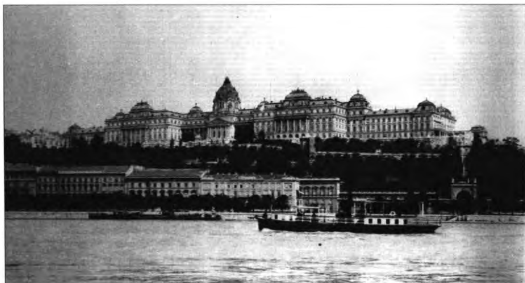
2.1.56. A palota látképe a Duna felől, 1912.