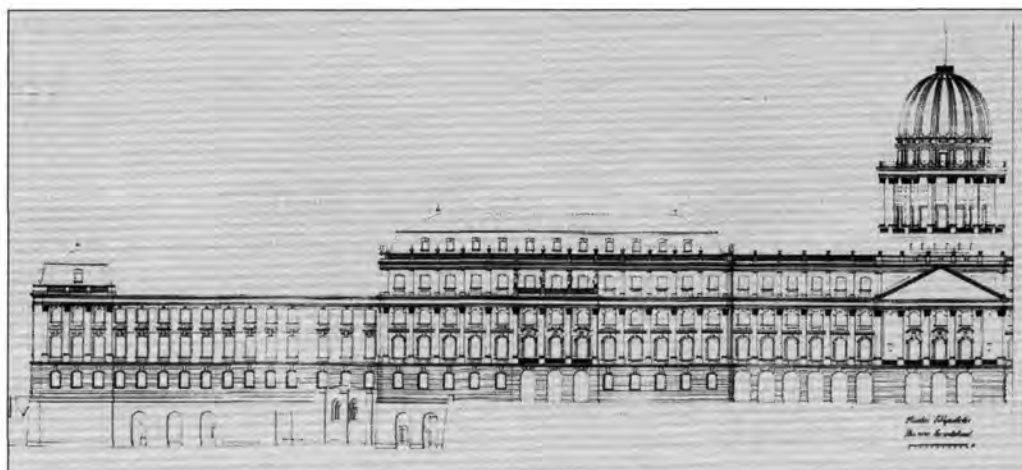
Janáky István: A budai várpalota oldalhomlokzata, 1958. OMvH Tervtár, lt. sz.: 1279. (részlet).

di-Flach-Gerő jegyezte tervekre vonatkozott a jóváhagyási kérelem. 16 A tervek legkarakteresebb és legneuralgikusabb eleme továbbra is a kupola volt, melynek meg nem valósulásával egy sajátos és a magyarországi szocreál gyakorlat egyetlen ilyen típusú építészeti formájával lettünk „szegényebbek”. 17 A PB június 14-én Szijártónak a várpalota helyreállításáról szóló előterjesztését levette napirendjéről. A javaslat a funkciók vonatkozásában hangsúlyeltolódást tartalmazhatott, mert a határozat szerint a PB elvben ugyan elfogadta a palota tudományos és kulturális intézmények céljára való hasznosítását, de azzal a megszorítással, hogy szükség esetén a párt- és állami vezetés számára is megfelelő legyen. 18 Janáky augusztusban Lux László építésügyi miniszterhelyettes társaságában meg is tartotta az előírt lakossági fórumot a várpalota újjáépíté-