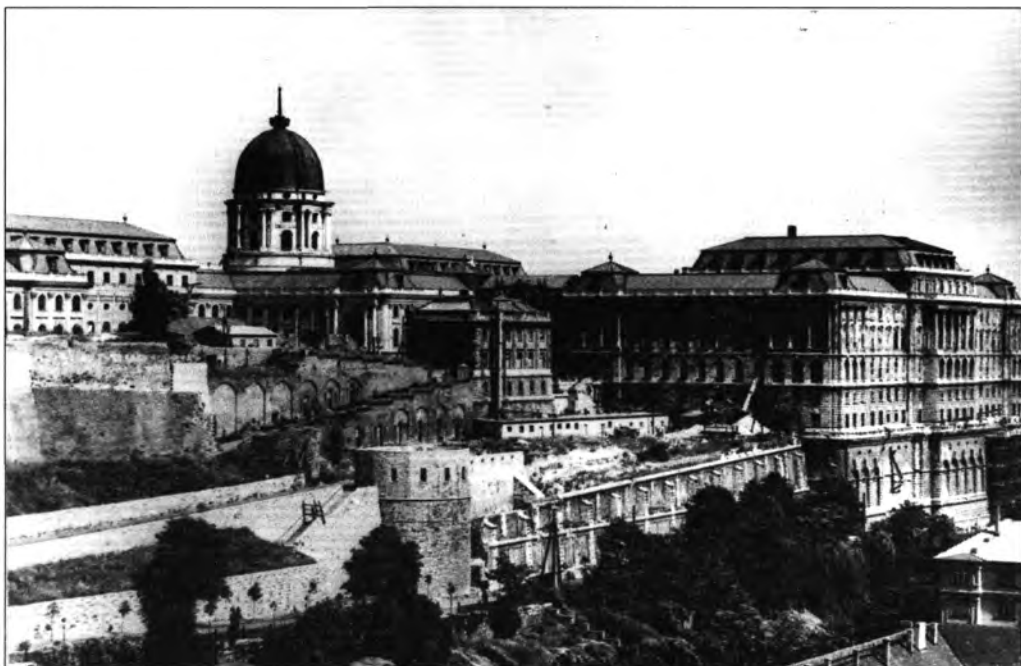
A Budavári Palota az újjáépült kupolával, 1964. Ismeretlen felvétele. BTM Kiscelli Múzeum, lt. sz.: F.2000.39., neg. sz.: 28.618/6 × 9.