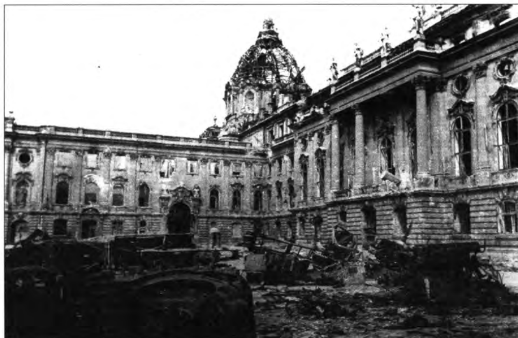
A romos kupola az Oroszlános udvarból, 1945. lt. sz.: F.2000.39., neg. sz.: 28.618/6 × 9.