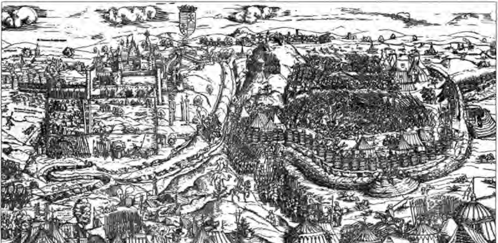
Buda ostroma, 1541. Erhard Schön fametszete (részlet).

1683-ban a szövetséges csapatok bécsi, majd párkányi győzelme után, szeptember 27-én Esztergom bevételével Buda elérhető közelségbe került. 1683 telén újból előkerült a korábbi terv a török elleni nemzet-