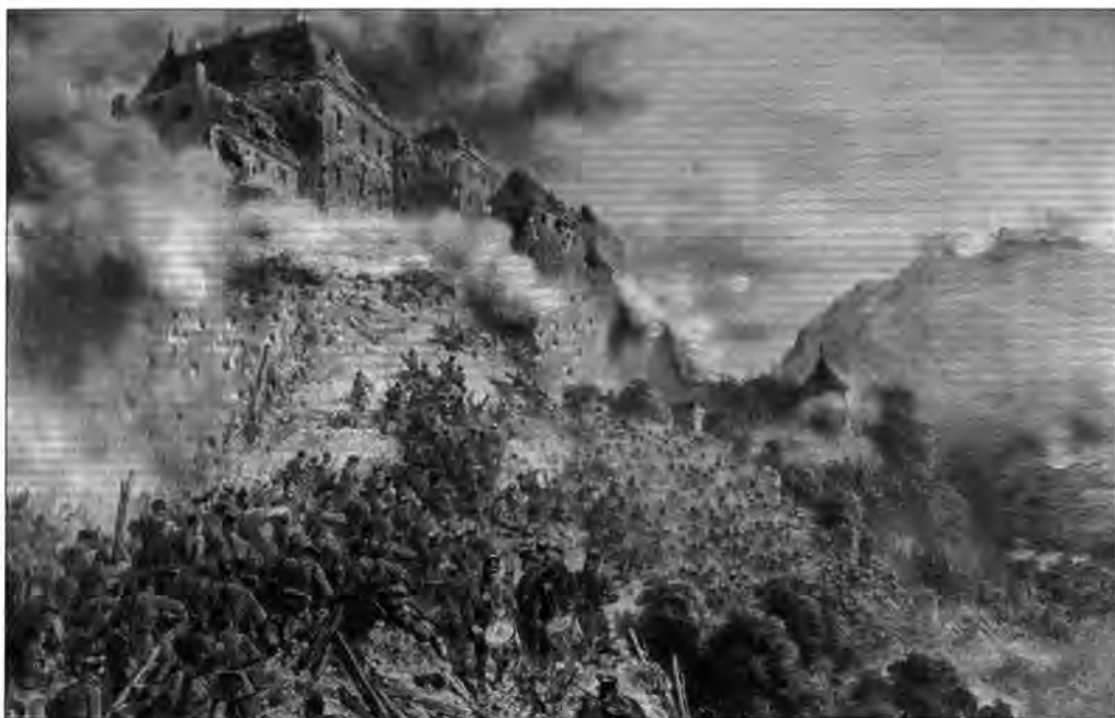
3.3.1. August von Pettenkofen: Budavár visszafoglaló ostroma északnyugatról, 1849. május 21-én.

volna április végén is. Ezt azonban előre nem lehetett látni, a magyar tervezés alapja április végén a jelentős erősítések bevárása volt, amelyre a politikai vezetés határozott ígéretet tett. Maga a döntés tehát, amely a vár ostromához vezetett, nem kárhoztatható, sokkal okosabbat abban a helyzetben nem lehetett volna tenni. A hadművelet végrehajtásában azonban már jócskán mutatkoztak hibák.