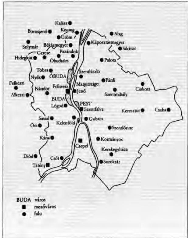
A főváros és környékének települései a középkor végén

Végül még egy adat Budára mint királyi székre vonatkozóan. 1521. június 29-én, Szulejmán nándorfehérvári hadjárata idején II. Lajos a pápához fordulva segítségért azt írta, Nándorfehérvár elfoglalása után a szultán azzal fenyegetőzik, hogy Budára megy, „ahol királyi székem van”. 24 Itt megint a „sedes” szó fordul