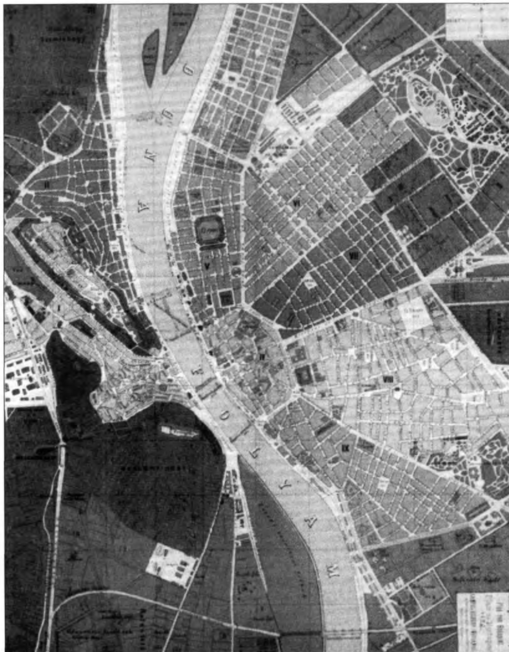
1.5.23. Budapest tervrajza, 1875 (részlet)

főváros lehet. A miniszterelnök ugyanis, midőn a kormány beiktatása után fogadta a két város tisztelegő küldöttségét, kijelentette előttük: Buda és Pest egymást kiegészítve alkotja Magyarország fővárosát. Pestet szerencsés helyzete, kereskedelmi fontossága jelöli fővárosi hivatásra, Buda pedig