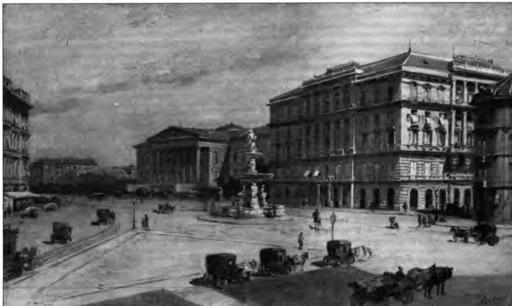
L.2. Balló Ede: Calvin tér, 1884

A kiállítás egy tudományos munkacsoport közös tevékenységének eredménye, amelyben a Budapesti Történeti Múzeum szakemberei mellett a Budapesti Fővárosi Levéltár és más múzeumok