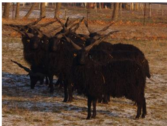
1. kép: Fekete racka kosok

gyűjtöttük. Az ejakulátumok térfogatát pipetta segítségével mértük. A spermiumok tömegmozgását Evans és Maxwell (1987) leírása szerint bíraltuk el 37 °C - ra előmelegített tárgylemezen 40 x nagyításban fáziskontraszt mikroszkóppal (Olympus BX51). A mozgást 1-5 pontszámmal osztályoztuk. Az ejakulátumok koncentrációját 1:400 - as fiziológias sóoldattal történt hígítást követően spektrofotométerrel határoztuk meg. A minták morfológiai vizsgálatát 1:200 - as fiziológias sóoldattal történt hígítás és Cerovsky-festést (1976) követően végeztük el 1000x-es nagyításban (2. kép).