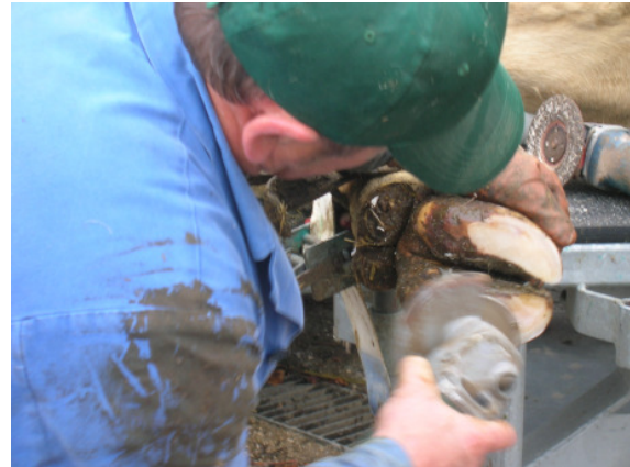
4.b. kép: A körmözés közelről

Picture 4.b. The footcare process on closer view