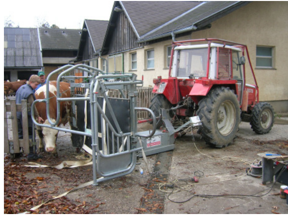
2. kép: Az állat beteretése

Picture 2. Driving the animal into the equipment