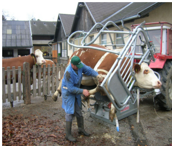
3. kép: A lábak rögzítése

5) A kaloda részleges megdőntése (30-45°) (3. kép).