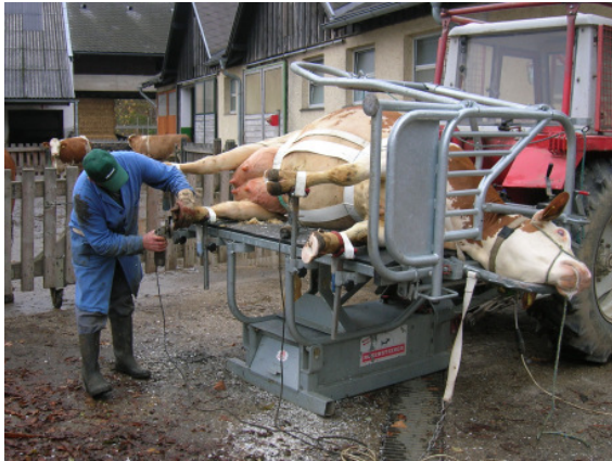
4.a. kép: A körmözés folyamata