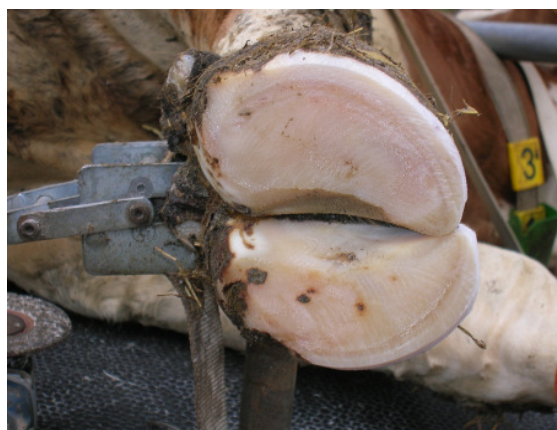
5. kép: A kész köröm