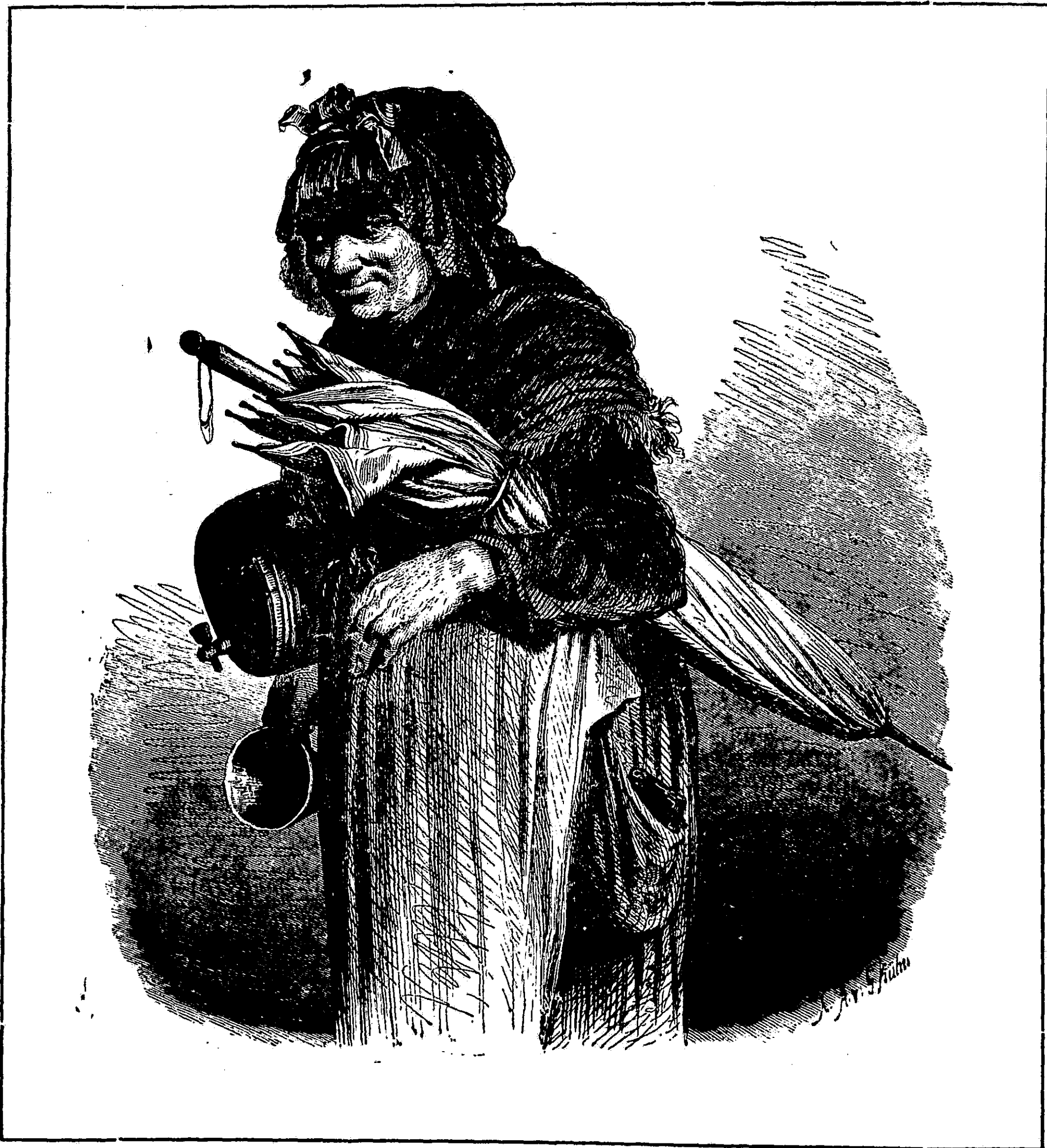
Fővárosi életképek. — III. A tintás-asszony.

A „ Magyar Szemle “ első füzete, mely már januárra szól, megjelent hetedfél sűrűn nyomott íven. A mint említettük, a negyedév óta pihenő „Havi Szemle“ folytatása ez, és szintén Bodnár Zsigmond szerkeszti. Nagyon kívánatos, hogy irodalmi vállalatunk, melyek komoly közönségre számítanak, izmosodjanak és terjedjenek, és a „Budapesti Szemle“, a „Magyar Szemle“, a „Koszoru“ tömegesen feltalálják olvasóikat. Elég