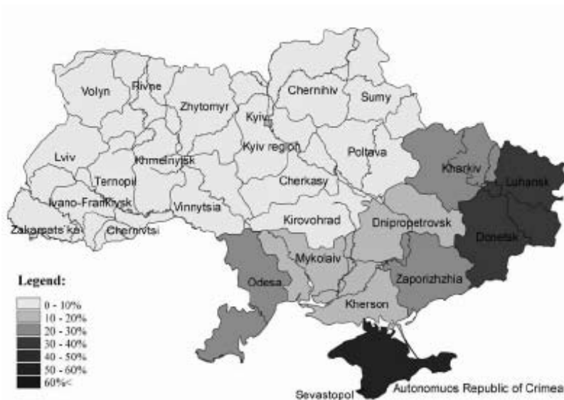
Рисунок № 2. Русскоязычное население по территории Украины (за данными переписи населения 2001 г.)

украинская политическая власть считала опасным для независимости и суверенитета Украины и полноценного функционирования украинского языка как государственного. Большинство политических лидеров Украины так называемых «демократических сил» уверены, что ассимиляционные процессы, которые произошли в советские времена в Украине, нужно немедленно повернуть, несмотря на то, хотя бы этого граждане, родной язык которых не украинский (Рябчук 2000). Это касается в первую очередь восточной и южной Украины, где значительная часть населения говорит на русском (рисунок № 2).