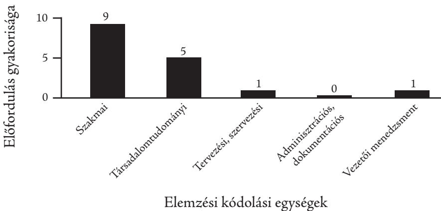
4. ábra Az egészségügyi szociális munka mesterképzési szakon megszerezhető tudás, ismeret, képesség (db)

A mesterképzési szakok esetén először az egészségügyi szociális munka mesterképzési szak vizsgálati eredményét mutatjuk be (4. ábra).