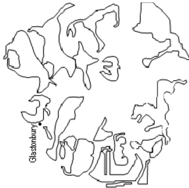
1. ábra. A földképek körvonalai. A Glastonbury körül fekvő „földképek” tükörképként mutatják az égvi jegyeket.