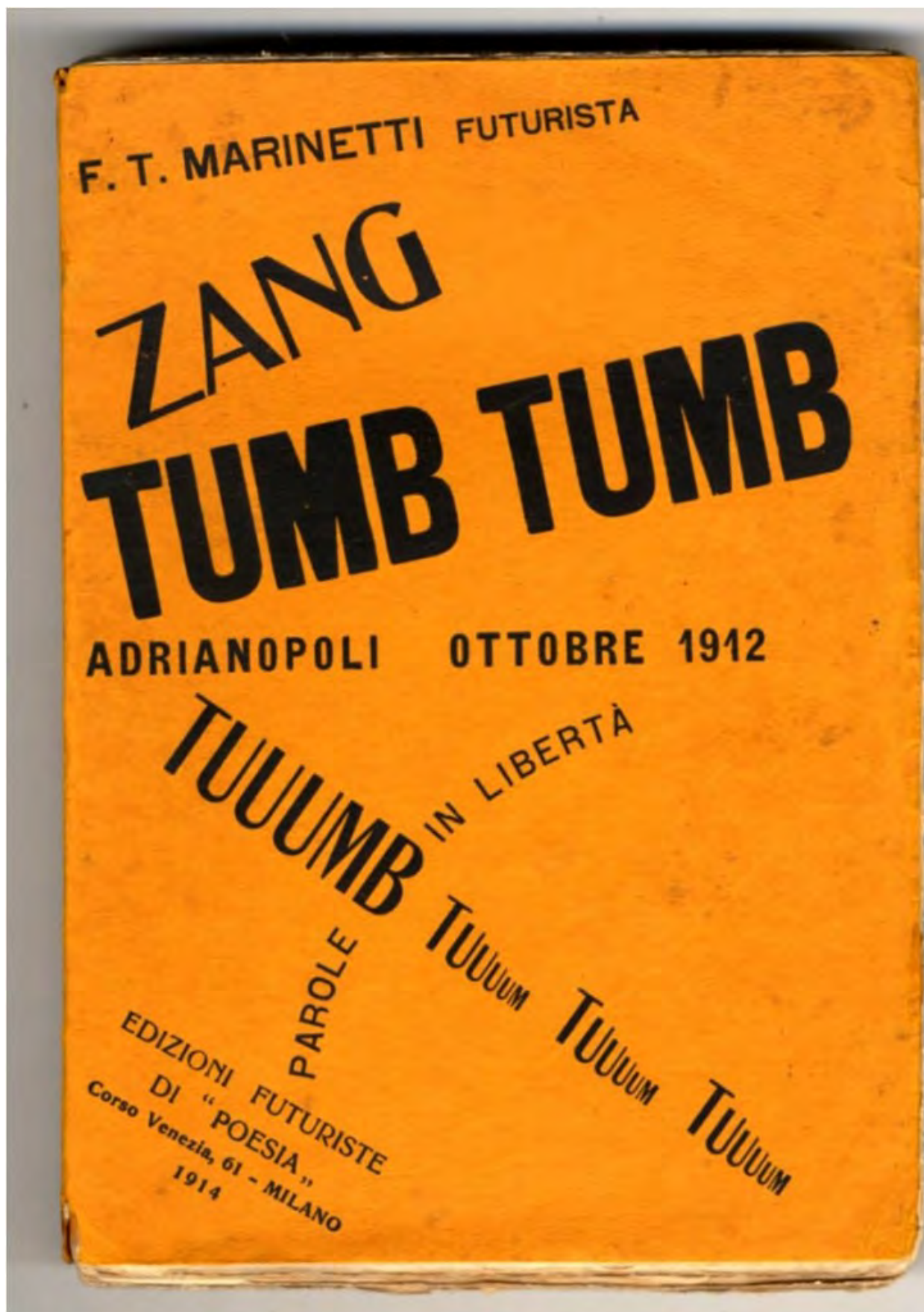
Filippo Tommaso Marinetti: Zang Tumb Tumb

szabadon értelmezendő partitúrája[9]. Sőt, a különleges kiadvány akár művészkönyvként is értékelhető.