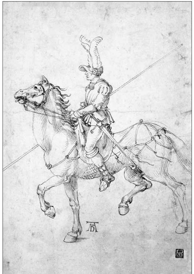
Albrecht Dürer műhelye: Lándzsás lovas (1502)

A korai termésből, 1410-15 tájáról ismeretlen cseh művész egész alakos Szent Margit ábrázolását említhetjük, fején koronával, jobbában kereszttel, a bűnt jelképező sárkányon taposva. Vegyes technikával, fekete tusba mártott ecsettel, fekete és vörös krétával, illetve szürke lavírozással (a rajz árnyékainak mélyítésére szolgáló eljárással – a szerk. ) készült. Albrecht Dürer húszas éve elején járt Velencében, ahol a természet- és emberábrázolás, a perspektíva és az anatómia problémáit kutatta. Hazatérése után nürnbergi műterme ifjú tehetségek gyülekező helye lett, akikre akarva-akaratlanul nagy hatást gyakorolt jellegzetes profilja éppúgy, mint megannyi virtuóz szakmai bravúrja. A múzeum két, igazoltan eredeti rajzot őriz tőle. (Korábban egyik tanítványa – Hans Schäußelein tanulmányával, illetve a Lándzsás lovas, 1502 barna tintás rajzával kapcsolatban is felmerült esetleges szerzőségének lehetősége.) Metszeteiből viszont közel kétszázötvenet szerzett meg a Szépművészeti Múzeum, s a leghíresebbekből most tízet mutatnak be. A séta (1495-96) című rézmetszetén elegáns ifjú pár szerelmi idillje látható pazar természeti környezetben. Az Apokalipszis fametszet-sorozatához tartozó Az Apokalipszis négy lovasa (1497-98 körül) a viharfelhőkben repülő angyaltól a paripák által földre tiport emberekig, kozmikus távlatokat ölt. Egy-egy rézlemezen akár évekig is dolgozott. Az eszmei férfi- és nőalakot megtestesítő Ádám és Éva (1504) kompozíciójához rajzolta a legtöbb előkészítő