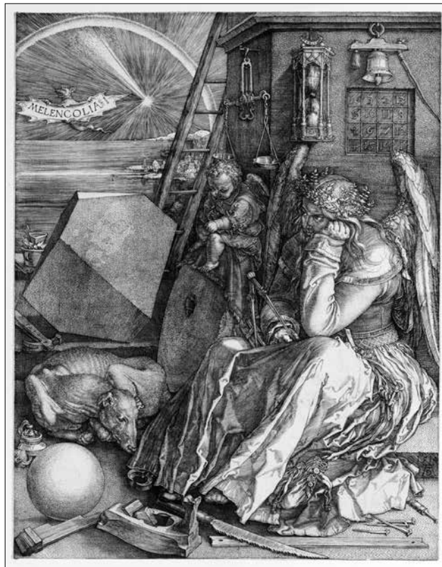
Albrecht Dürer: Melankólia I. (1514)