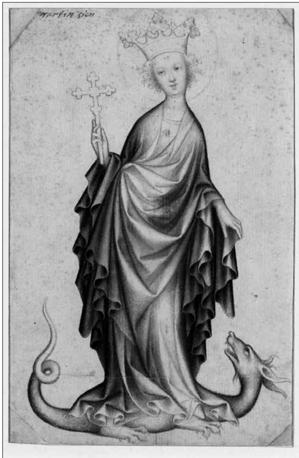
Cseh művész: Szent Margit (1410-15 k.)