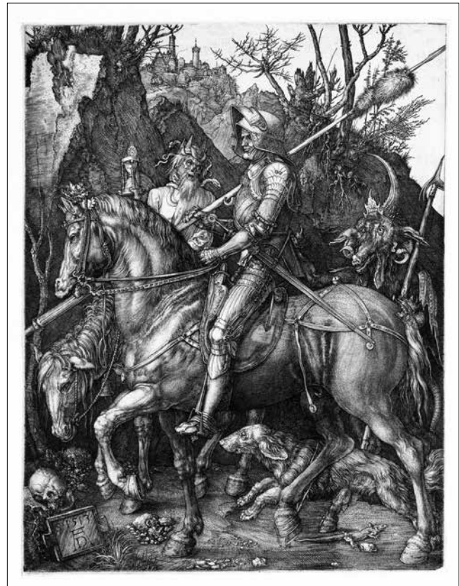
Albrecht Dürer: A lovag, a halál és az ördög (1513)