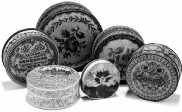
Díszdobozok virágos mustrával, Kugler-Gerbeaud páros felirattal