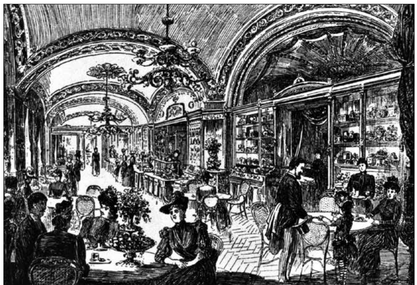
A Gerbeaud-cukrászda belseje (korabeli metszet)