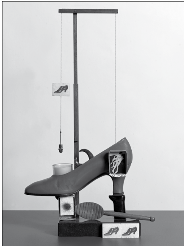
Salvador Dalí: Szimbolikus működésű skatalogikus tárgy ( Gala cipője) 1931/73

A harmadik részleg két főszereplője Max Ernst és Joan Miró. Előbbitől az olaj-vászon Khimaira (1928) előtérben kiterjesztett szárnyú, karmos-karvalycsőrös-emplős sasmadara, illetve mögötte a szelíd galamb hófehér árnyképeinek szín- és formaellentétét említhetjük, továbbá A vízbe fulladt ember elegáns gesztusa (1929) vágott és ragasztott papír kollázsát. Mirótól az azonos technikájú Festmény (1930) amőba-formájú körvonalba zárt, laza ecsetvonásokkal felvitt „táját” hozhatjuk fel példaként. Talán az eddigiekből is kiderül, hogy a szürrealista mozgalomra az új témák felfedezése mellett jellemző volt az újfajta alapanyagok és alkalmazott technikák beveté-