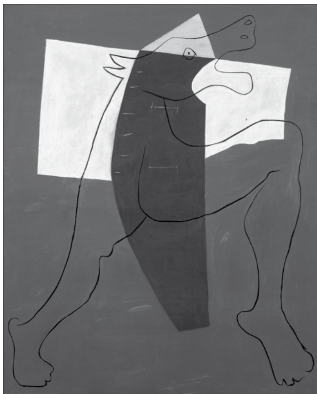
Pablo Picasso: Futó Minótaurusz

A művészet kedvelőinek nem kell viszont külön bemutatnunk a máig világszerte népszerű belga René Magritte jellegzetes világát, amely a hatodik traktust uralja. Az ellentétekre épülő felfogásának kiváló példája olajképe, A kettős titok (1927), melyen a rejtelmes Nofretetére hajazó, függőlegesen kettészelt női mellszobor szarkofágszerűen kimerevített, plasztikává kozmetikázott külső maszkjával, illetve ennek hús-vér belsejével, amelynek drasztikussága kórboncnokian valóságos. Nem ennyire krimiszzerű, inkább festőien látványos A vörös modell (1935), amelynek bokacsizmára emlékeztető, aprólékosan kidolgozott mezítelen lábával éppúgy kiaknázza az ellentétekben rejlő meglepő hatásokat. Magritte élet-