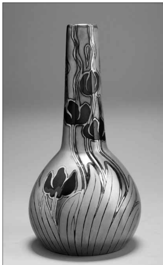
Zsolnay gyár: Tulipános porcelán- fajansz váza (1899)