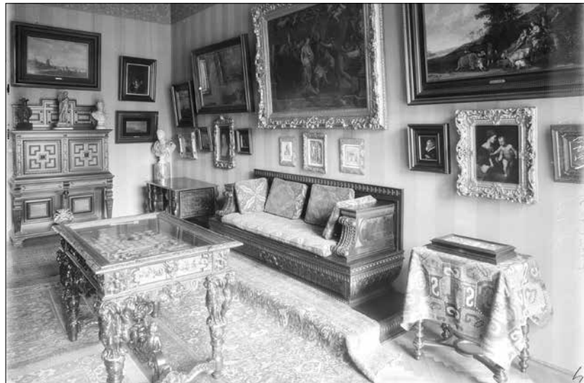
Ráth György kép- és éremgyűjteménye

Ezzel a címmel látható szeptember derekától állandó kiállítás az átmeneti bezárás után újra megnyílt Ráth-villában (Budapest VI. Városligeti fasor 12.). A földszinti termék eredeti berendezése mellett összesen 600 (!) műtárgy sorakozik az emeleti látványtárban. Ezeket az Iparművészeti Múzeum több évig tartó felújítása miatt szállították ide, hogy addig se rejtőzzenek raktárak mélyén az érdeklődők elől. A nemzetközi szecesszió magyar, osztrák, brit és francia részlegén gyönyörködhetünk ebben a jellegzetesen „összművészeti” irányzatban. A falikárpitoktól a bútorokon át a legkülönbébb – fából, fémből, fajanszból, üvegből, bőrből vagy mindezek összeállításából született – használati és dísz tárgyakig, csillároktól padlószőnyegekig, kovácsoltvas lépcsőkörlátoktól ólomüveg ablakokig számtalan felfedezni való várja a látogatókat.