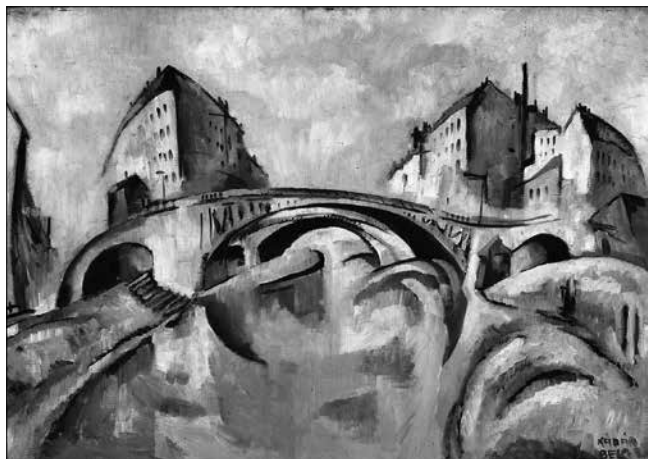
Kádár Béla: Városkép híddal (1921 k.)

Szent István Király Múzeum – Deák Gyűjtemény, Székesfehérvár