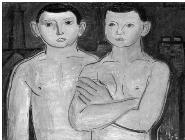
Barcsay Jenő: Vörös fiúk (Munkások) 1928 k.

Szent István Király Múzeum – Deák Gyűjtemény, Székesfehérvár